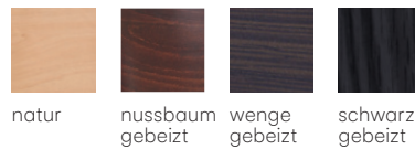
natur nussbaum gebeizt wenge gebeizt schwarz gebeizt

Großbräpportige oder karierte Stoffe, sowie zweifarbige Polsterungen werden mit 5 % Mehrpreis berechnet, Lederverarbeitung und Rapportbeachtung mit 10%.