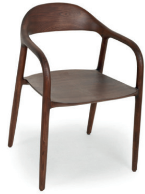
AVILA SESSEL Gestell Walnuss dunkel gebeizt

* Auslaufartikel 2026 - Nur solange der Vorrat reicht.