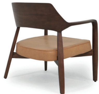
AVILA LOUNGESESEL Gestell Walnuss dunkel gebeizt, Kunstleder Nubola 12