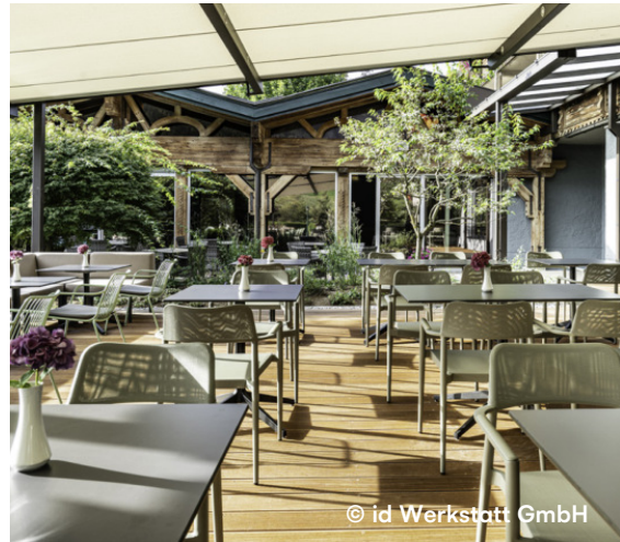
Hotel Pirchnerhof, Reith