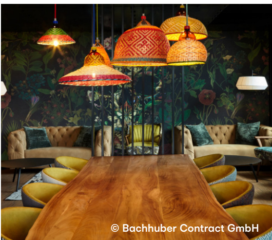
Bunker Hamburg, Hamburg