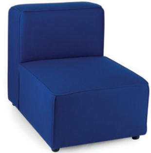
VARSO S STUHLELEMENT Material kundenseits