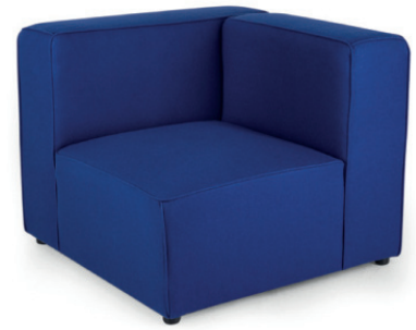
VARSO E ENDELEMENT Material kundenseits, linkes oder rechtes Element

GroÙrapportige oder karierte Stoffe, sowie zweifarbige Polsterungen werden mit 5 % Mehrpreis berechnet, Lederverarbeitung und Rapportbeachtung mit 10%.