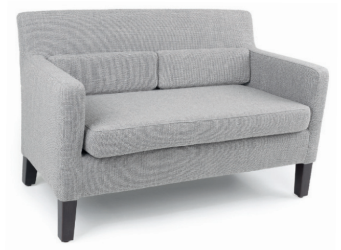
LORD ZWEISITZER Gestell schwarz, Material kundenseits