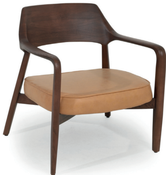
AVILA LOUNGESESEL Gestell Walnuss dunkel gebeizt, Kunstleder Nubola 12