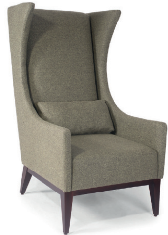
DANTE OHRENSESSEL Gestell nussbaum, Material kundenseits