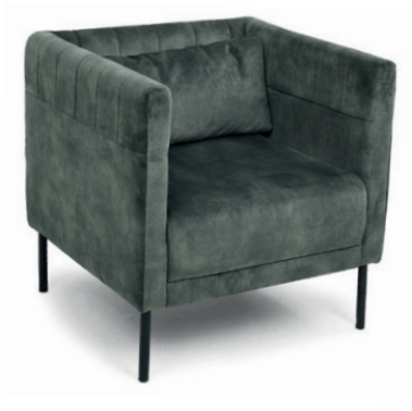
BETTI SESSEL Gestell schwarz, Stoff Abel Hunter