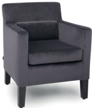
LORD POLSTERSESSEL Gestell schwarz, Stoff Richmond anthracite 67