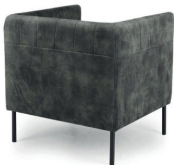
BETTI SESSEL Gestell schwarz, Stoff Abel Hunter