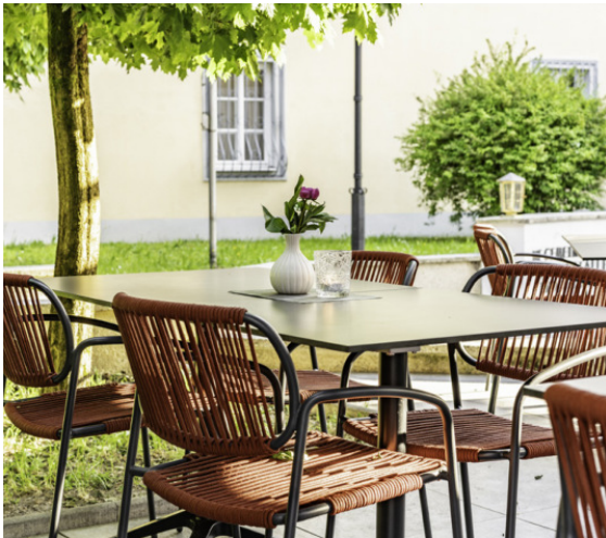
Wirt am Platzl, Garst

Prämierte Bars, coole Cafés, Luxusrestaurants, Bäckereiketten, Sushi-Tempel, Meeting-Bereiche im Großraumbüro, Burger-Läden - von praktisch robust bis edel luxuriös - unsere Referenzen sind so vielseitig wie unser Programm! Überzeugen Sie sich selbst: