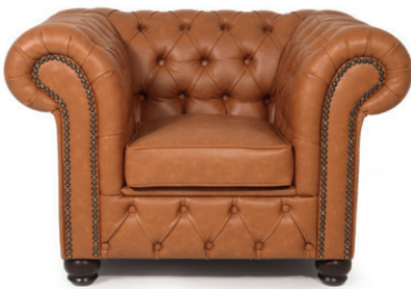
Gestell wenge, Kunstleder Western cognac