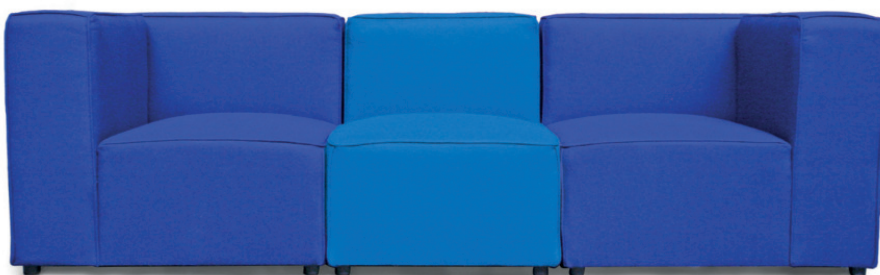
VARSO E ENDELEMENT Material kundenseits, linkes oder rechtes Element