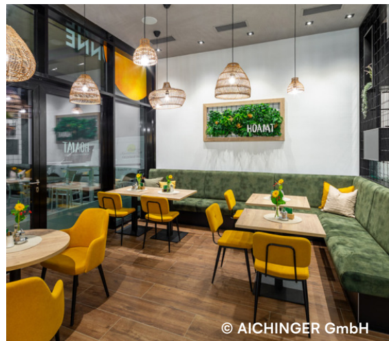
Bäckerei Frühwirth, Liebenau