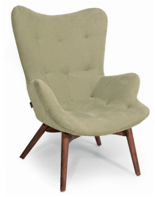
FEATHERTON LOUNGESESEL Gestell classic walnut, Material kundenseits