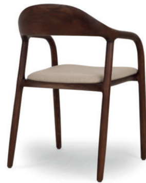
AVILA SESSEL Gestell Walnuss dunkel gebeizt, Sitz mit Polsterplatte, Stoff Fana natural