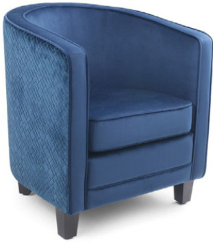
BRISTOL SESSEL Gestell wenge, Material kundenseits