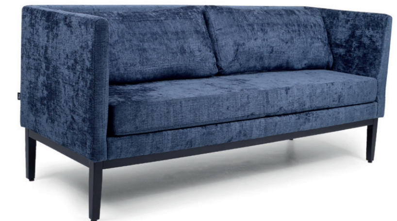
JIMMIE SOFA Gestell schwarz, Stoff Florence 17