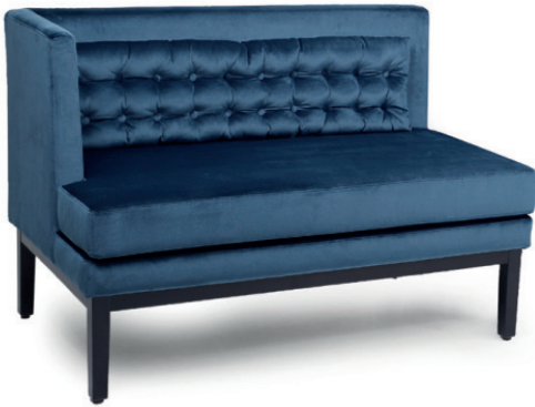
JIMMIE ENDELEMENT Gestell schwarz, Stoff Richmond Royalblue, lose Kissen mit Knopfheftung