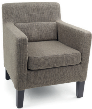
LORD POLSTERSESSEL Gestell wenge, Material kundenseits

Füße Buche gebeizt: natur, nussbaum, wenge, schwarz Sitz und Rücken gepolstert, inklusive losen Rückenkissen, Kunststoffgleiter