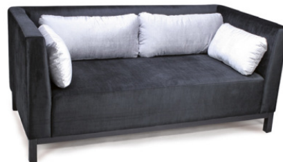
SALSA XL DREISITZER Gestell schwarz, Material kundenseits