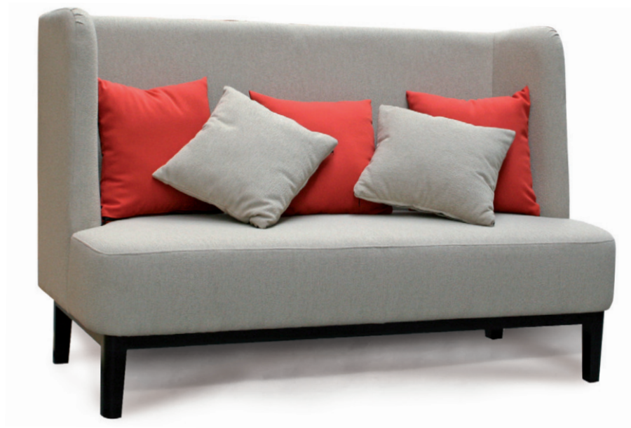
VANESSA 160 SOFA Gestell schwarz, Material kundenseits