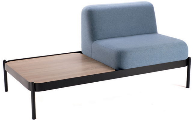
NOMEA DOPPELEMENT, Kombination mit Tisch Stuhlelement Stoff MAIN LINE FLAX Epping und Qualitätsspan- platte E1 Dekor R20128 RU Sonoma Eiche hell