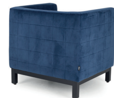
SALSA SESSEL Gestell schwarz, Stoff Velluto Navy, Quadratsteppung außen