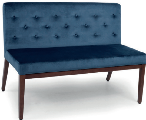
JESS BANK Gestell nussbaum gebeizt, Stoff Palazzo 051