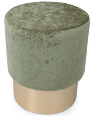
BOTTE R 39/150 HOCKER Gestell Messingoptik, Stoff Riviera RE Olive, Sockelhöhe 150 mm