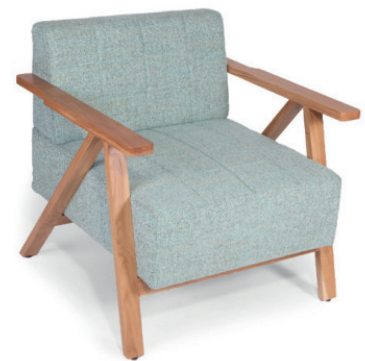
MARSELLUS POLSTERSESSEL Gestell Eiche natur, Stoff Tila lightblue