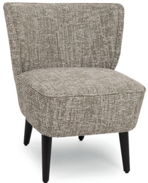
NONNA 1 POLSTERSTUHL Gestell Buche schwarz, Stoff Lausanne Army