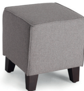
KUBIK HOCKER - nur mit Keder erhältlich - Gestell wenge, Stoff Fana RE Dolphin