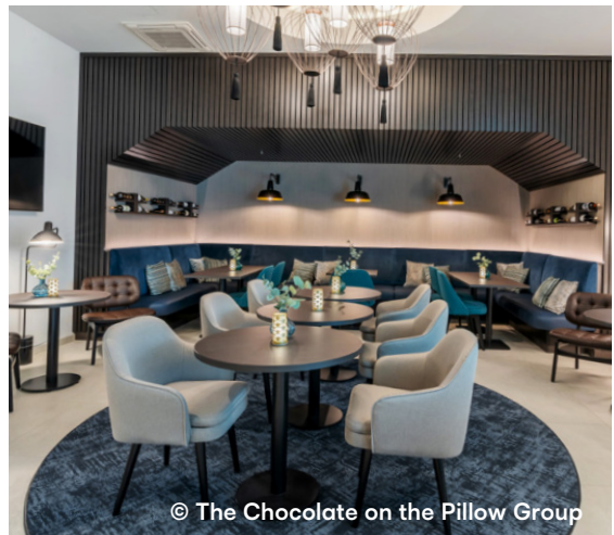
GHOTEL Hotel&Living, Würzburg