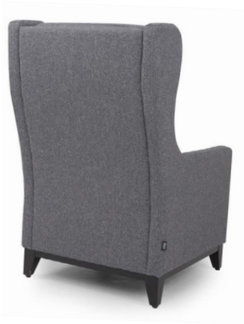
DOUGLAS OHRENSESSEL Gestell wenge, Material kundenseits