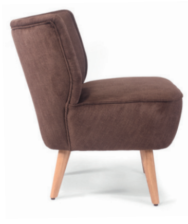
NONNA 1 POLSTERSTUHL Gestell Eiche natur, Material kundenseits