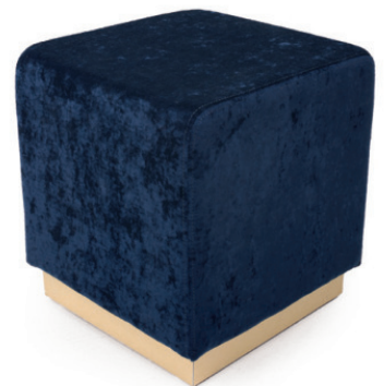
BOTTE E 42/60 HOCKER Gestell Messingoptik, Material kundenseits, Sockelhöhe 60 mm