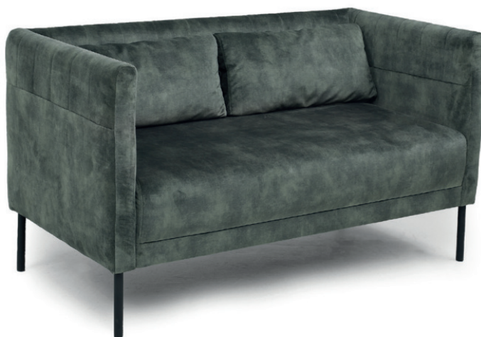
BETTI ZWEISITZER Gestell schwarz, Stoff Abel Hunter