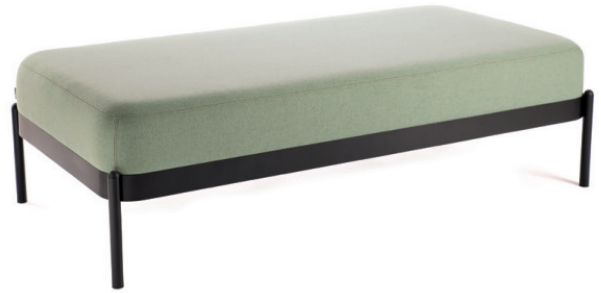
NOMEA HOCKERBANK DOPPELEMENT Stoff MAIN LINE FLAX Greenwich