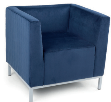
SOLO SESSEL Gestell aluminiumfarben, Stoff Velleto RE Navy, Quadratsteppung außen