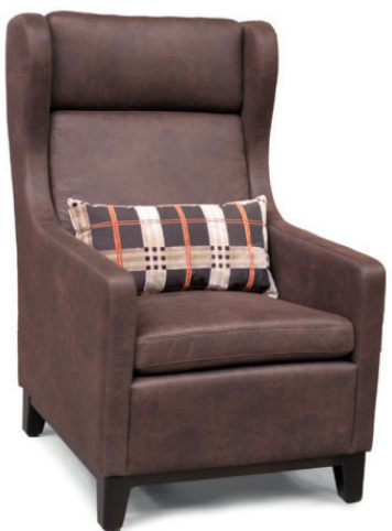
DOUGLAS OHRENSESSEL Gestell wenge, Material und Kissen kundenseits