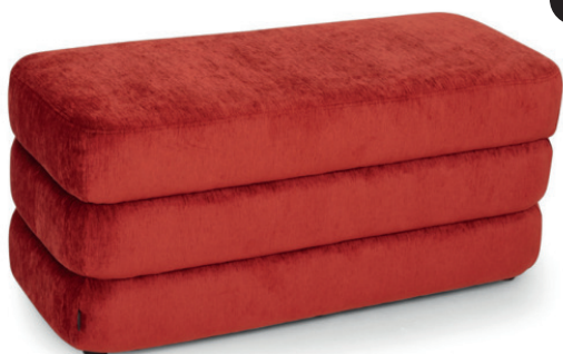
CAPAS HOCKERBANK SCHICHTEN Kunststofffüße schwarz, Livenza Scarlet