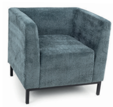
SOLO SESSEL Gestell schwarz, Material kundenseits

Großrapportige oder karierte Stoffe, sowie zweifarbige Polsterungen werden mit 5 % Mehrpreis berechnet, Lederverarbeitung und Rapportbeachtung mit 10%.