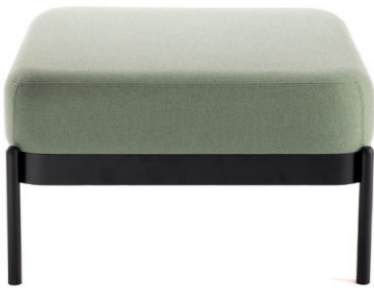
NOMEA HOCKER EINZELEMENT Stoff MAIN LINE FLAX Greenwich