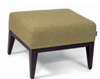
DANTE HOCKER Gestell wenge, Material kundenseits