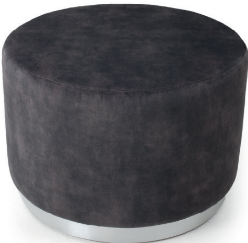
BOTTE R 66/60 HOCKER Gestell Edelstahloptik, Stoff Abel Anthracite Sockelhöhe 60 mm