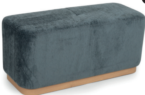
CAPAS HOCKERBANK STEPPUNG Laminat Eiche, Livenza Royal Blue