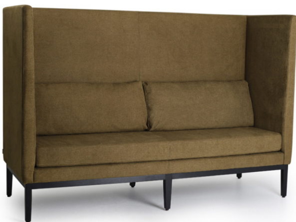
JIMMIE HIGHBACK Gestell wenge, Stoff Mel Army, mit geraden Armlehnen