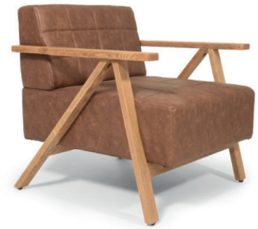
MARSELLUS POLSTERSESSEL Gestell Eiche natur, Kunstleder Western Almond

natur nussbaum gebeizt wenge gebeizt schwarz gebeizt