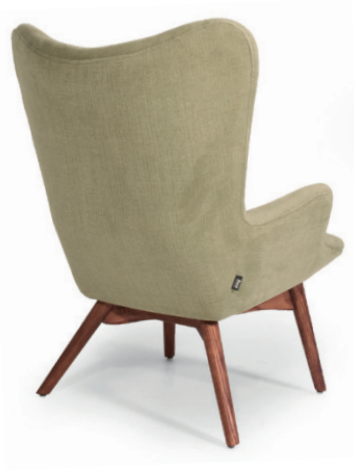
FEATHERTON LOUNGESESEL Gestell classic walnut, Material kundenseits

Randers: Gestell Eiche classic walnut gebeizt, Rücken mit 3 Knöpfen