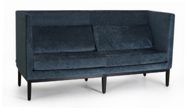
JIMMIE MIDBACK 2 Gestell wenge, Stoff Livenza Royalblue, mit geraden Armlehnen