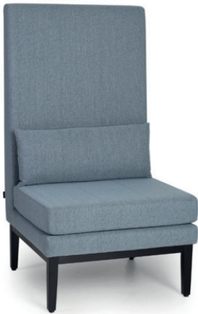
JIMMIE STUHLELEMENT Gestell schwarz, Stoff Vince 51