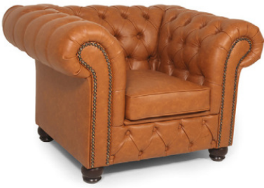
DOWNHAM SESSEL Gestell wenge, Kunstleder Western cognac

Füße Buche, wenge oder schwarz gebeizt, Sitz und Rücken gepolstert, Rücken und Seitenteile mit Knopfheftung, Nagelband