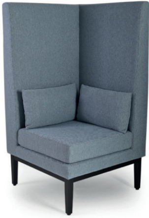
JIMMIE ECK-/ENDELEMENT Gestell schwarz, Stoff Vince 51