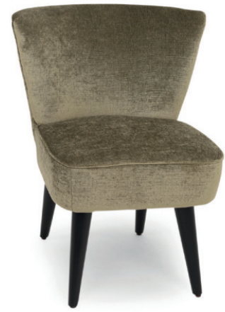
PAULETTE POLSTERSTUHL Gestell schwarz, Stoff Riviera RE Olive