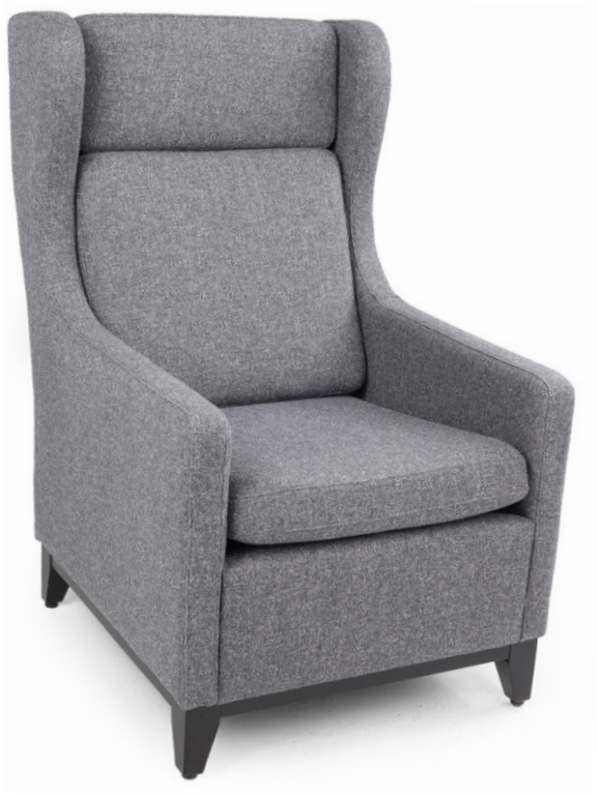
DOUGLAS OHRENSESSEL Gestell wenge, Material kundenseits