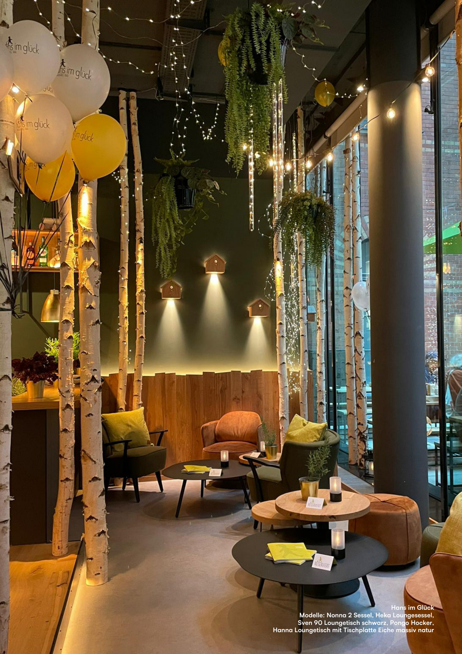
Hans im Glück Modelle: Nonna 2 Sessel, Heka Loungesessel, Sven 90 Loungesessel, Pongo Hocker, Hanna Loungesessel mit Tischplatte Eiche massiv natur