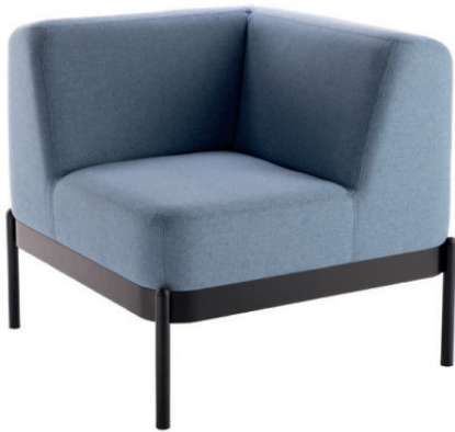
NOMEA ECK-EINZELEMENT Stoff MAIN LINE FLAX Epping