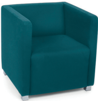
BRADFORD SESSEL Metallfüße verchromt, Material kundenseits