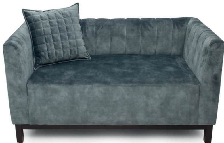
SALSA ZWEISITZER Gestell wenge, Stoff Abel Hunter, Pfeifensteppung im Rücken innen