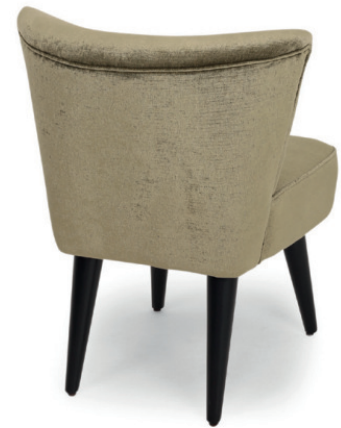
PAULETTE POLSTERSTUHL Gestell schwarz, Stoff Riviera RE Olive