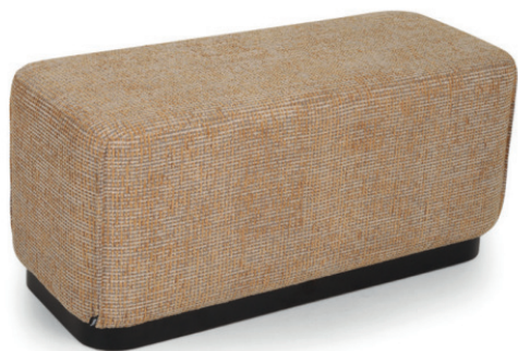
CAPAS HOCKERBANK ZIERNAHT Laminat Schwarz, Lausanne Gold