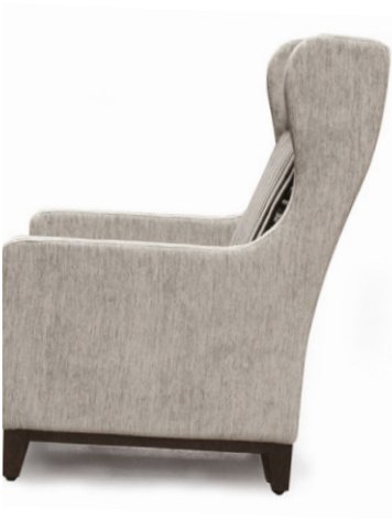
DOUGLAS OHRENSESSEL Gestell wenge, Material kundenseits