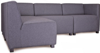
BRADFORD ECKELEMENT Gestell schwarz, Material kundenseits

Füße Buche gebeizt: natur, nussbaum, wenge, schwarz Sitz und Rücken gepolstert, Kunststoffgleiter