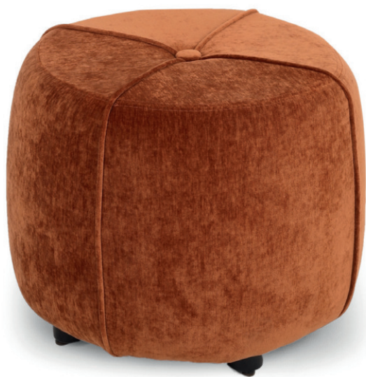
PONGO HOCKER Gestell wenge, Livenza Copper