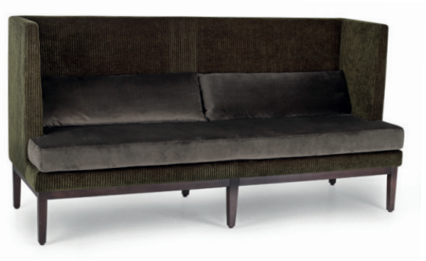
JIMMIE MIDBACK 1 Gestell nussbaum, zweifarbige Polsterung, Stoff Barril Forest, Richmond Hunter, mit eingerückten Armlehnen