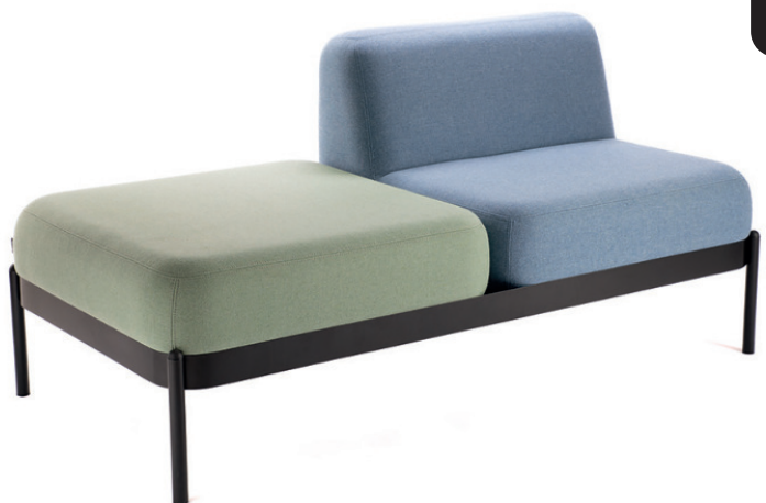
NOMEA DOPPELEMENT, Kombination mit Stuhl und Hockerelement