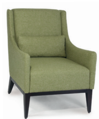
DANTE SESSEL Gestell wenge, Material kundenseits