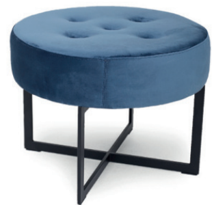
NORA L HOCKER Gestell schwarz, Stoff Velleto RE Indigo, mit Knopfheftung