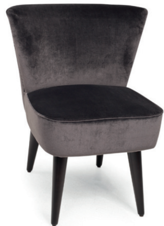
PAULETTE POLSTERSTUHL Gestell schwarz, Material kundenseits