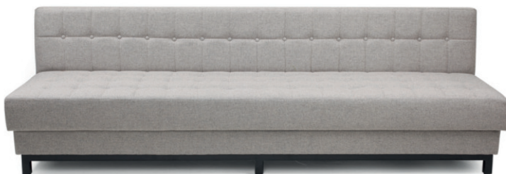
MADRID LOUNGEBANK mit Knopfheftung, Stoff kundenseits, Gestell Buche schwarz gebeizt