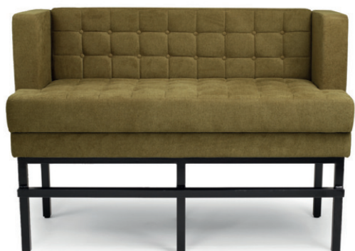
MADRID HOCHBANK mit Knopfheftung, Stoff Mel Army 14, eckiges Metallgestell schwarz,