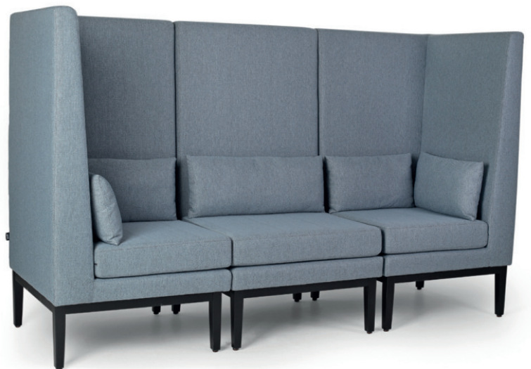
JIMMIE ECK-/ENDELEMENT Gestell schwarz, Stoff Vince 51