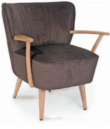
NONNA 2 POLSTERSESSEL Gestell Eiche natur, Material kundenseits