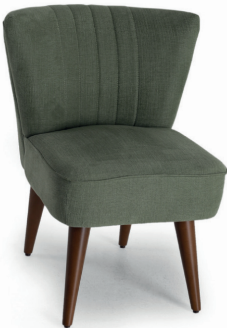
PAULETTE POLSTERSTUHL Gestell nussbaum, Material kundenseits, Vertikalsteppung im Rücken