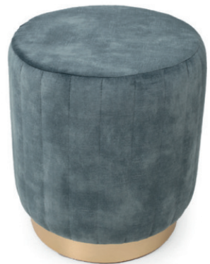
BOTTE R 39/60 HOCKER Gestell Messingoptik, Stoff Abel Niagara, mit Pfeifensteppung, Sockelhöhe 60 mm