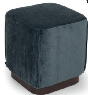
CAPAS HOCKER ZIERNAHT Laminat Walnuss, Livenza Royal Blue