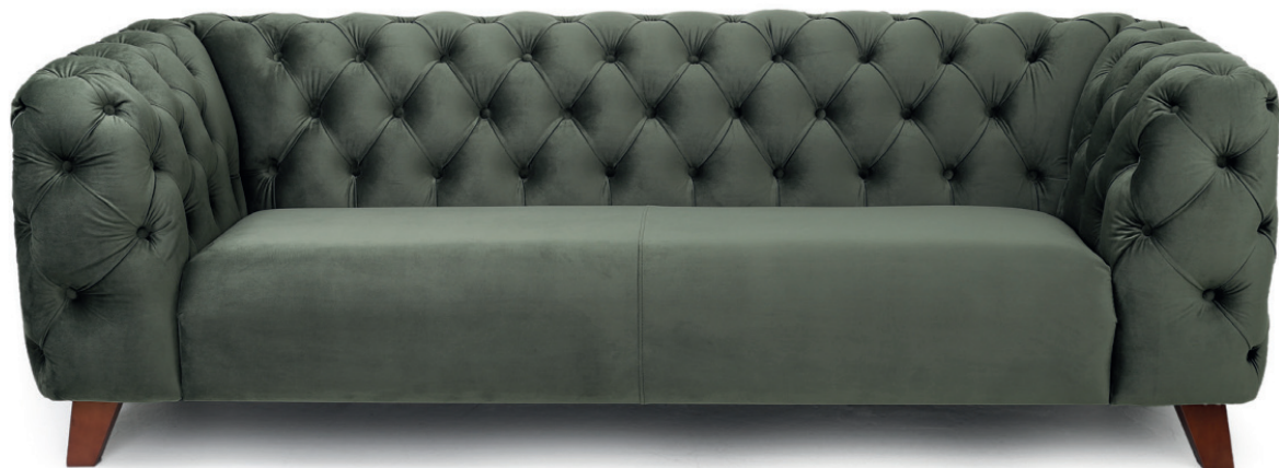
ROCCO SOFA Füße Buche, cognac gebeizt, Material kundenseits