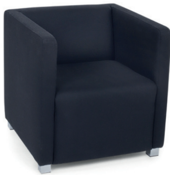
BRADFORD SESSEL Metallfüße verchromt, Material kundenseits