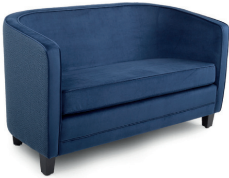
BRISTOL ZWEISITZER Gestell wenge, Material kundenseits