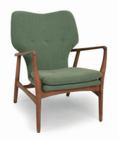
RANDERS LOUNGESESEL Gestell classic walnut, Material kundenseits

Kunstleder und Leder sind nicht möglich. Großrapportige oder karierte Stoffe, sowie zweifarbige Polsterungen werden mit 5 % Mehrpreis berechnet und Rapportbeachtung mit 10%.