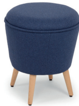
PIET HOCKER Gestell natur, Stoff Fana RE Blue