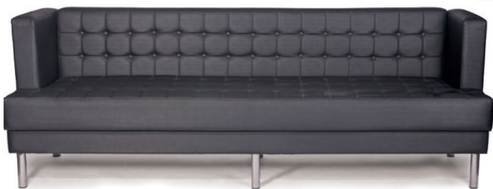
MADRID BANK mit Seitenteilen und Knopfheftung, Stoff kundenseits, rundes Metallgestell verchromt

Lederverarbeitung ist nur bis zu einer Materialdicke von 1,2 mm möglich. Großrapportige oder karierte Stoffe, sowie zweifarbige Polsterungen werden mit 5 % Mehrpreis berechnet, Lederverarbeitung und Rapportbeachtung mit 10 %. Unsere Metallgestelle werden mit Stopfen ausgestattet.