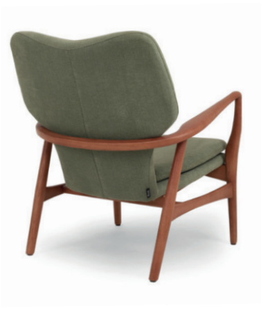
RANDERS LOUNGESESEL Gestell classic walnut, Material kundenseits