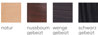
natur nussbaum gebeizt wenge gebeizt schwarz gebeizt

Großrapportige oder karierte Stoffe, sowie zweifarbige Polsterungen werden mit 5 % Mehrpreis berechnet, Lederverarbeitung und Rapportbeachtung mit 10 %.