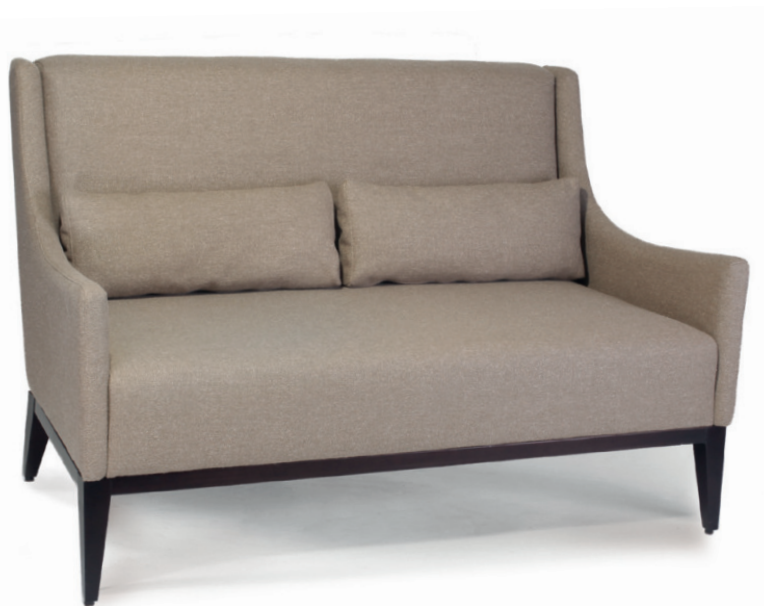
DANTE ZWEISITZER Gestell wenge, Material kundenseits