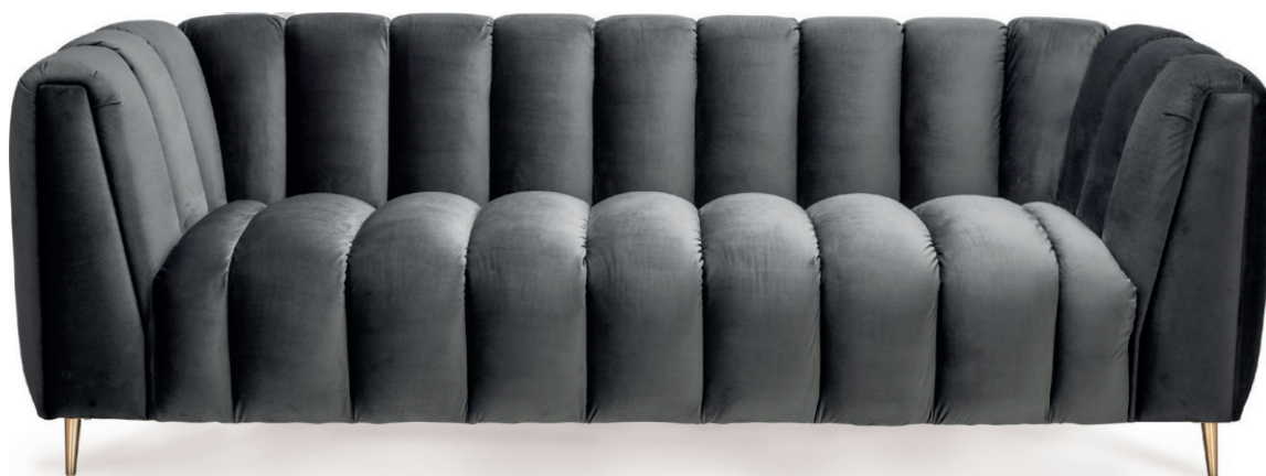
DAUPHINE SOFA Metallfüße in Messingoptik, Stoff Richmond Hunter

Lederverarbeitung ist nur bis zu einer Materialdicke von 1,2 mm möglich. Großbrapportige oder karierte Stoffe, sowie zweifarbige Polsterungen werden mit 5 % Mehrpreis berechnet, Lederverarbeitung und Rapportbeachtung mit 10 %.