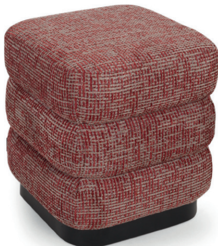
CAPAS HOCKER SCHICHTEN Laminat Schwarz, Lausanne Carmine