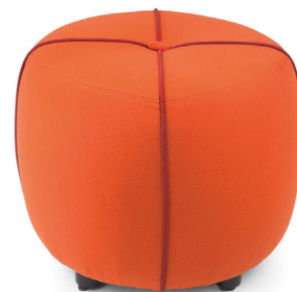
PONGO HOCKER Gestell wenge, Material kundenseits