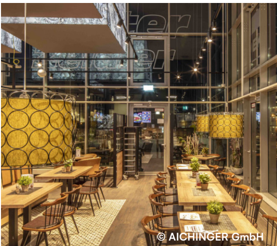
E-Center Zeidler, Königslutter