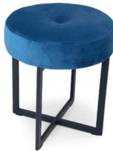
NORA S HOCKER Gestell schwarz, Stoff Palazzo, mit Knopfheftung

Großrapportige oder karierte Stoffe, sowie zweifarbige Polsterungen werden mit 5 % Mehrpreis berechnet, Lederverarbeitung und Rapportbeachtung mit 10 %.