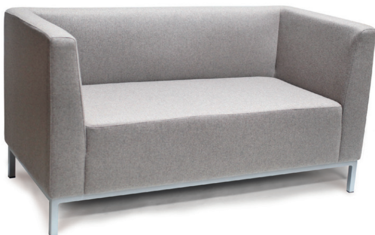
SOLO ZWEISITZER Gestell aluminiumfarben, Stoff Fana RE Dolphin