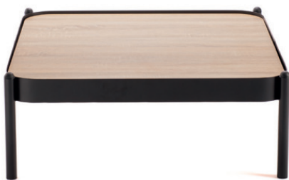
NOMEA TISCH EINZELEMENT