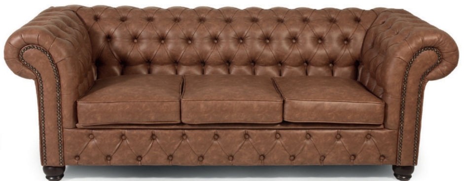
DOWNHAM DREISITZER Gestell wenge, Kunstleder Western Almond