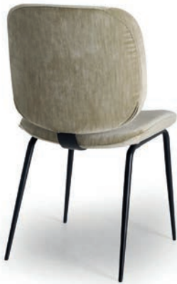
LAVIO STUHL LIVIA Champagne

Stahlrohrgestell schwarz pulverbeschichtet, Sitz und Rücken aus Formschaum , Kunststoffgleiter