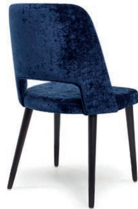
LOVENA 1/O STUHL wenge RICHMOND Royalblue