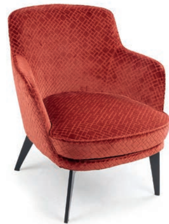
TAYLOR LOUNGESESEL Material kundenseits 82 75 75 41

Großrapportige oder karierte Stoffe, sowie zweifarbige Polsterungen werden mit 5 % Mehrpreis berechnet, Lederverarbeitung und Rapportbeachtung auf Anfrage.