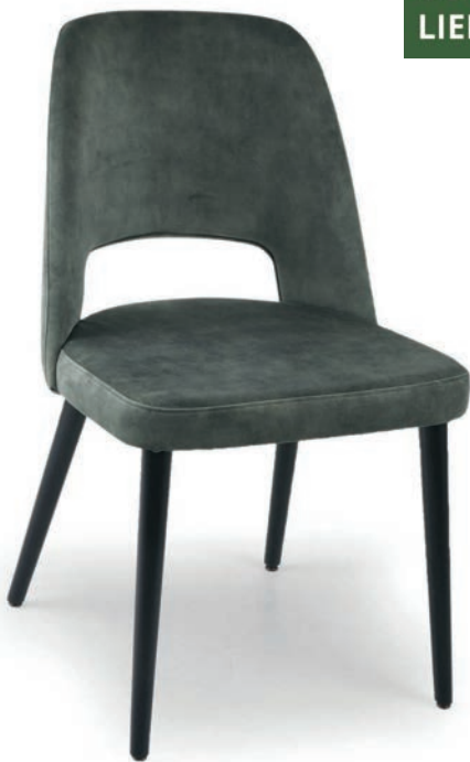
LOVENA 1/O STUHL schwarz ABEL Hunter