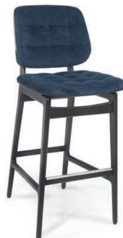
SAINTFIELD H BARHOCKER mit Heftung VELLUTO Indigo