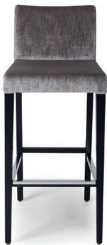
621-3 BARHOCKER Fußschiene Inox Material kundenseits

Großbräpportige oder karierte Stoffe, sowie zweifarbige Polsterungen werden mit 5 % Mehrpreis berechnet, Rapportbeachtung mit 10 %. Lederverarbeitung auf Anfrage.