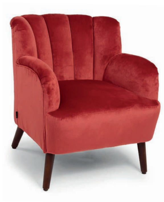
SIX LOUNGESESEL nussbaum RICHMOND Carmine