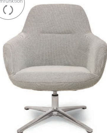
OLINA SPIN LOUNGESESSL Material kundenseits