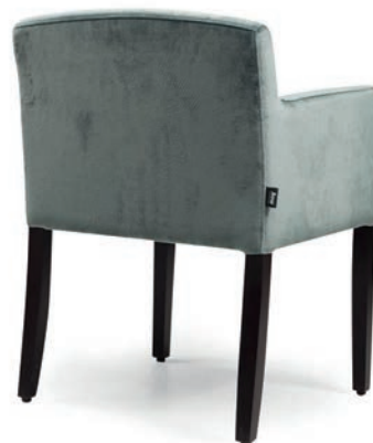
BRIGHTON 2 SESSEL wenge Material kundenseits