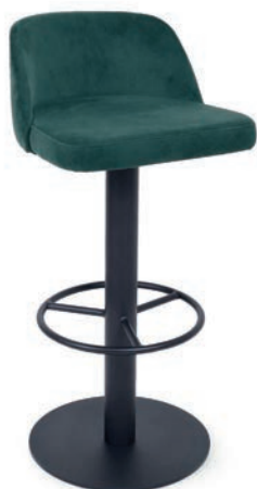
MODENA BAR 7

Eisengussbasis schwarz, Stahlrohrsäule schwarz lackiert, Fußring