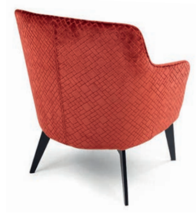
TAYLOR LOUNGESESEL Material kundenseits