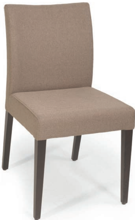
614-1 STUHL nussbaum GKL Taupe

Großbräunliche oder karierte Stoffe, sowie zweifarbige Polsterungen werden mit 5 % Mehrpreis berechnet, Lederverarbeitung und Rapportbeachtung auf Anfrage.