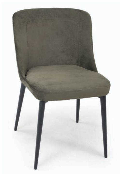
TAFT 1 STUHL Material kundenseits