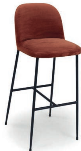
ELIA BARHOCKER VELLUTO Copper h A h h 108 46 56 80