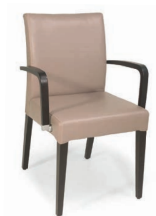
614-22 SESSEL runde Armlehnen nussbaum GKL Taupe