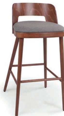
COCKTAIL 1 BARHOCKER Walnuss hell Material kundenseits