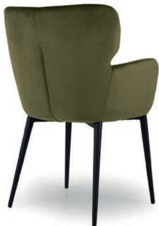
BRODY SESSEL VELLUTO Turtle

Großrapportige oder karierte Stoffe, sowie zweifarbige Polsterungen werden mit 5 % Mehrpreis berechnet, Lederverarbeitung und Rapportbeachtung auf Anfrage.