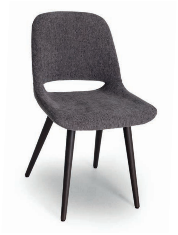
MAGDALENA STUHL wenge ROYAN 66 h A h h 83 52 59 47