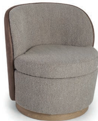
MOMA LOUNGESESSEL Laminat Eiche APIA Beige Rücken: NAMUR Bown 15