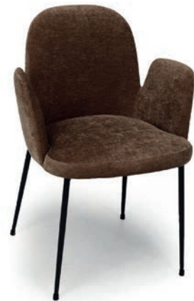
ELIA SESSEL Material kundenseits h A h h 83 61 55 46