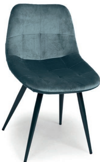
DODGER STUHL ABEL Hunter