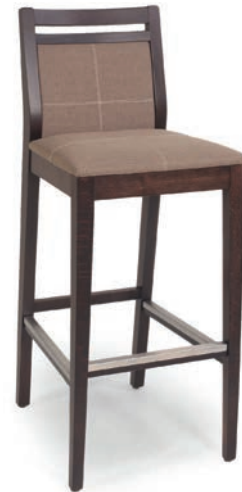
6465 BARHOCKER nussbaum Material kundenseits 106 42 48 78