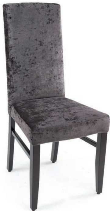
CARDIFF STUHL wenge Material kundenseits h A h h 101 46 55 50

Großrapportige oder karierte Stoffe, sowie zweifarbige Polsterungen werden mit 5 % Mehrpreis berechnet, Lederverarbeitung und Rapportbeachtung mit 10 %.