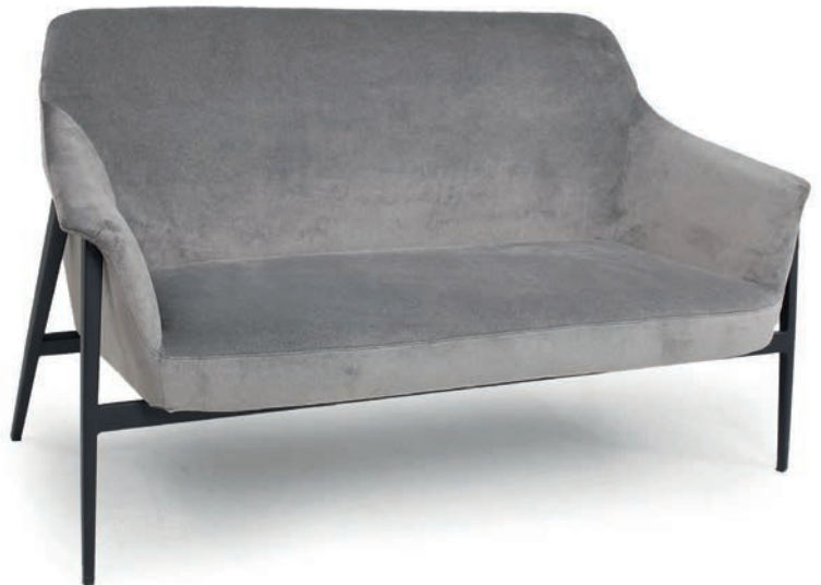
CLEVELAND 2 ZWEISITZER VELLUTO Dolphin