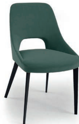
VICTORIO STUHL Material kundenseits 82 47 56 47