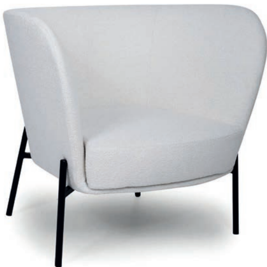
VERENA LOUNGESESSL APIA Ivory