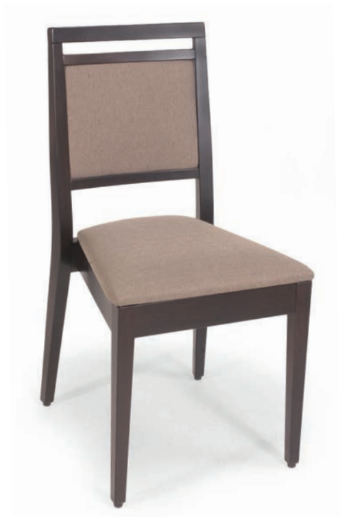
670 ST STUHL stapelbar nussbaum Material kundenseits