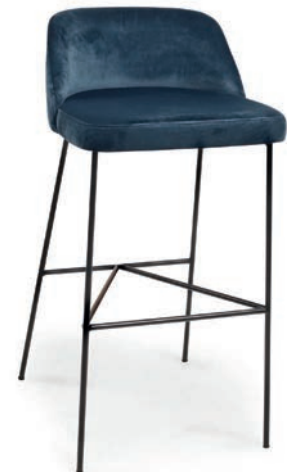
LOVENA 2 M BARHOCKER PALAZZO 051 96 48 56 80