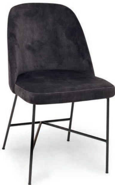
LOVENA 1 M STUHL ABEL Darkgrey