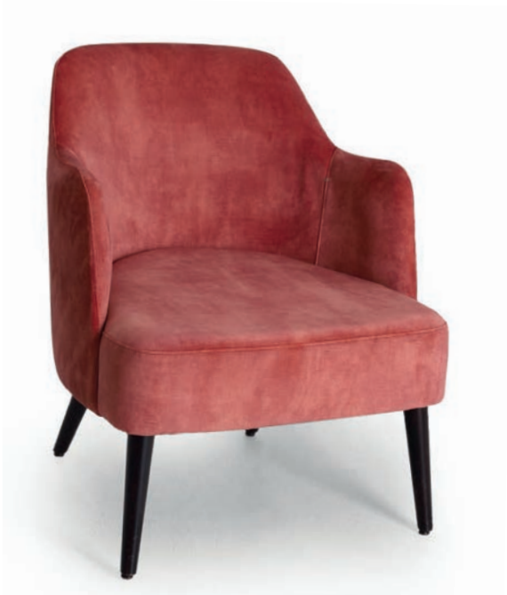
LOVENA LOUNGESESSEL wenge ABEL Blush