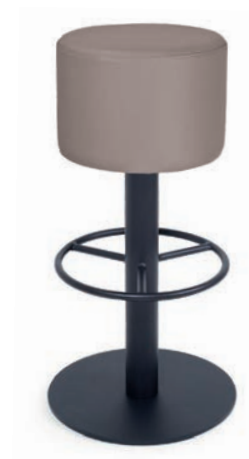
MODENA BAR 4 zylindrischer Polsterkopf Sitz drehbar, Ø 37 cm Gewicht 18 kg CKL Sand A h h 45 45 77