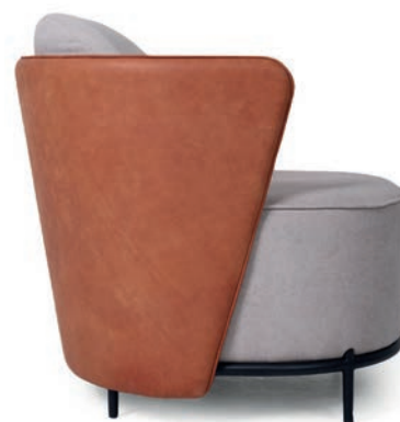
HEKA LOUNGESESEL zweifarbige Polsterung Material kundenseits