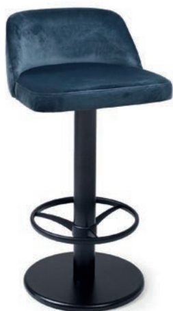
BARTENDER 7 Sitz drehbar, Gewicht 22,1 kg VELLETO RE Indigo

Eisengussbasis schwarz, Fußring aus poliertem Aluminiumguss oder schwarz lackiert, Stahlrohrsäule schwarz lackiert