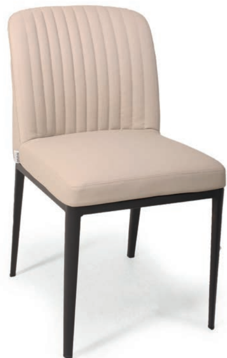
4101 STUHL Pfeifensteppung GRANOSA Hellbeige