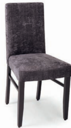
CARDIFF 90 STUHL wenge Material kundenseits h A h h 90 46 55 50