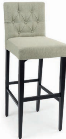
CARDIFF BARHOCKER Rücken capitoniert wenge Material kundenseits h A h h 111 45 52 80