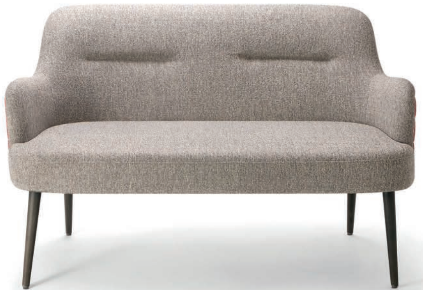
DA VINCI SOFA Polsterart A wenge Material kundenseits

Großbrapportige oder karierte Stoffe, sowie zweifarbige Polsterungen werden mit 5 % Mehrpreis berechnet, Lederverarbeitung und Rapportbeachtung auf Anfrage.