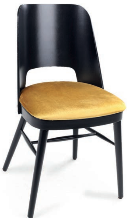
COCKTAIL 1 STUHL PALAZZO 040