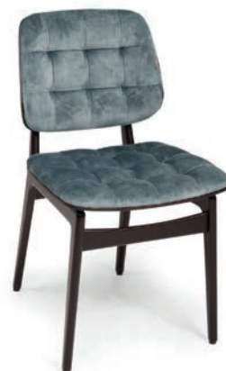
SAINTFIELD 1 H STUHL mit Heftung ABEL Niagara

Großbrapportige oder karierte Stoffe, sowie zweifarbige Polsterungen werden mit 5 % Mehrpreis berechnet, Lederverarbeitung auf Anfrage.