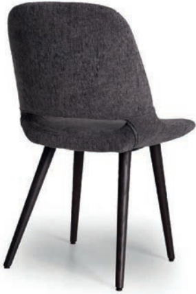
MAGDALENA STUHL wenge ROYAN 66

Stuhl, Sessel und Loungesessel Sitzschale gepolstert, Esche gebeizt, Robustagleiter Kunststoff