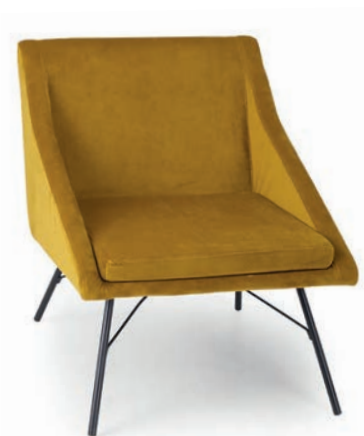
GREG LOUNGESESSEL VELLETO RE Mustard 71 63 79 42