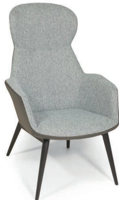
DETROIT LOUNGESESEL zweifarbige Polsterung Material kundenseits 103 66 78 42

Großbrapportige oder karierte Stoffe, sowie zweifarbige Polsterungen werden mit 5 % Mehrpreis berechnet, Lederverarbeitung und Rapportbeachtung auf Anfrage.