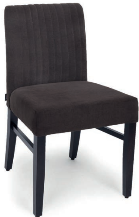
ARTUR 1 STUHL wenge Pfeifensteppung im Rücken Material kundenseits