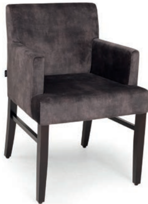
ARTUR 2 SESSEL nussbaum ABEL coffee