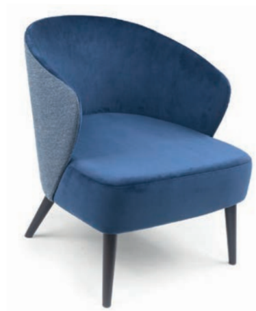
DARFORD LOUNGESESSEL Material kundenseits