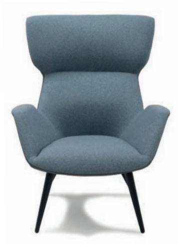
NORFOLK LOUNGESESEL Material kundenseits 101 78 88 41