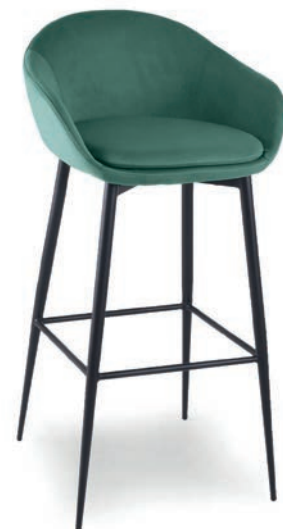
VIVAL BARHOCKER VELLUTO Eukalyptus