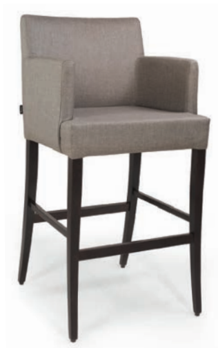
ARTUR BARHOCKER wenge Material kundenseits