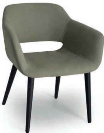
MAGDA LOUNGESESSEL schwarz Material kundenseits h A h h 82 70 68 42