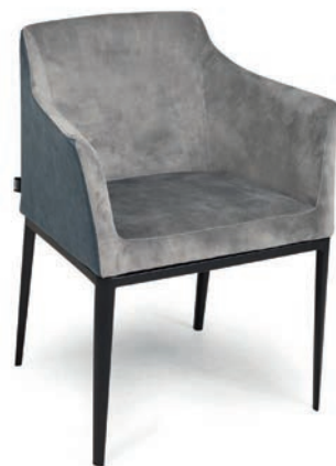
4108 M SESSEL zweifarbige Polsterung Material kundenseits