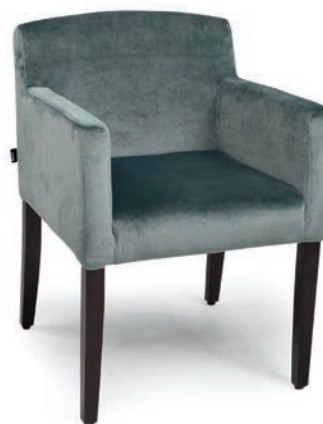
BRIGHTON 2 SESSEL wenge Material kundenseits 78 56 60 48