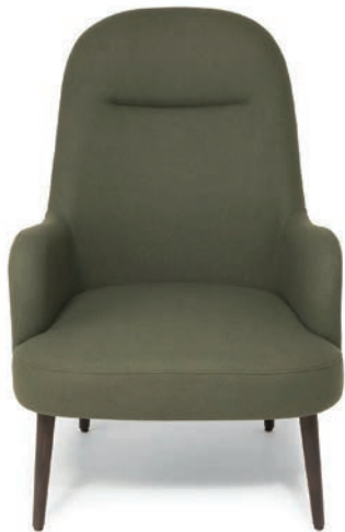
DA VINCI 5/100 LOUNGESESSL Polsterart A wenge Material kundenseits h A h h 100 66 83 41