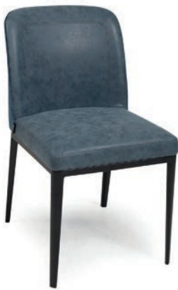
4101 STUHL Rücken glatt NUBOLA 18