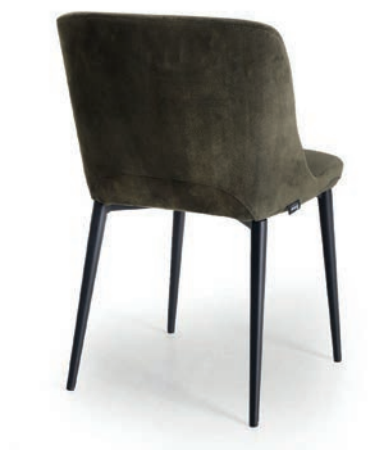
TAFT 1 STUHL Material kundenseits