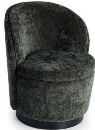
MOMA SESSEL Laminat schwarz LIVIA Bottle Green

Großrapportige oder karierte Stoffe, sowie zweifarbige Polsterungen werden mit 5 % Mehrpreis berechnet, Lederverarbeitung und Rapportbeachtung auf Anfrage.