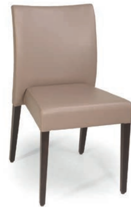
614-1 ST STUHL stapelbar nussbaum GKL Taupe