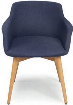
4116 H SESSEL Eiche natur FANA RE Navy h A h h 76 60 58 47