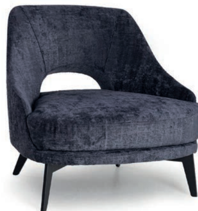
VICTORIA 85 LOUNGESESSL FLORENCE 11 80 85 84 43