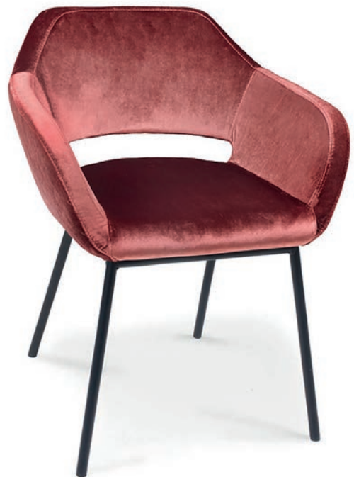
MANU M SESSEL matt schwarz PALAZZO 065 Rücken PERINO 065