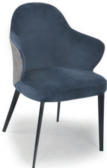
LOLA SESSEL VELLUTO Navy