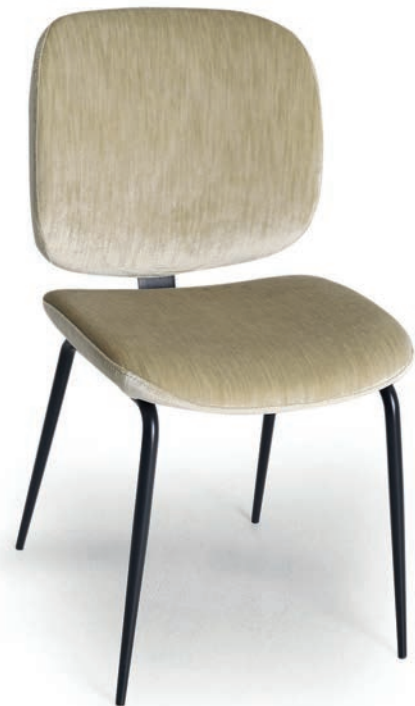
LAVIO STUHL LIVIA Champagne h A h h 85 46 58 48