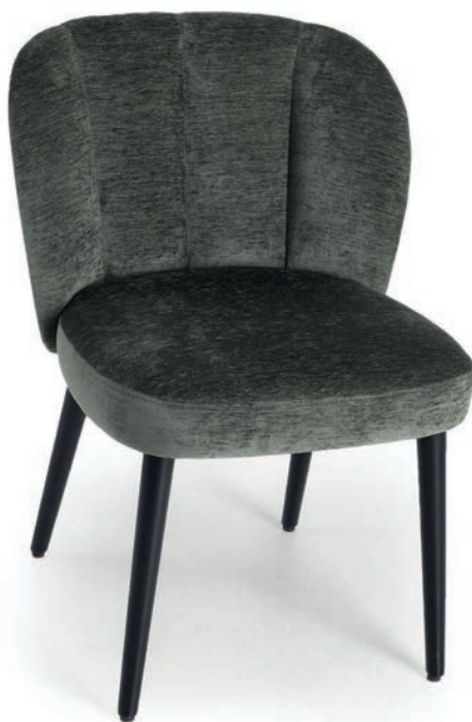
ASTOR STUHL schwarz LIVENZA Eukalyptus 78 58 60 47