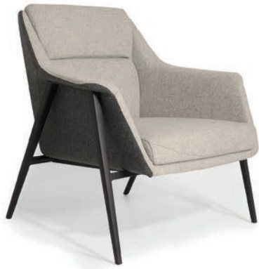
CLEVELAND 1 LOUNGESESSEL

zweifarbige Polsterung Material kundenseits