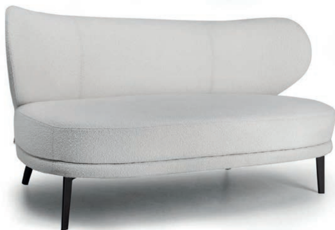
MABEL ZWEISITZER APIA Ivory