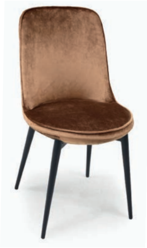
TENOR STUHL PALAZZO 074