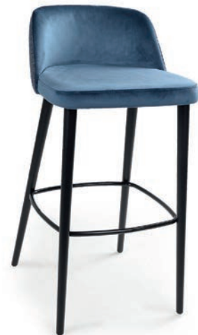
LOVENA 1 BARHOCKER wenge PALAZZO 051