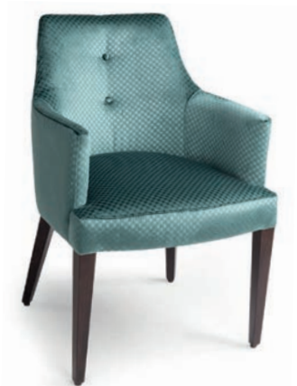
6606 SESSEL nussbaum Material kundenseits 85 60 66 47