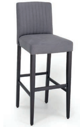
CARDIFF BARHOCKER Pfeifensteppung h A h h 111 45 52 80