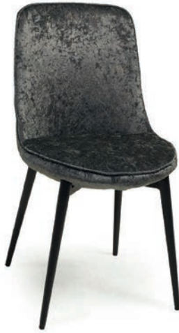
TENOR STUHL CRYSTAL TWINKLES 6022 Dark Green