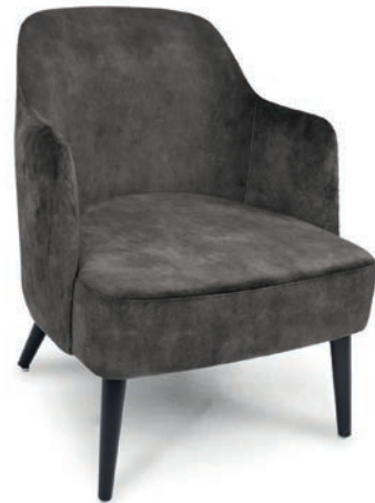
wenge ABEL Darkgrey