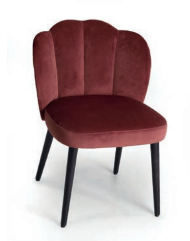
ASTORIA STUHL wenge VELLETO RE Burgundy 78 58 60 47