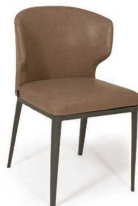
4111 M SESSEL WESTERN Liver