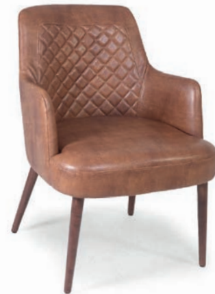
DA VINCI 3 SESSEL Polsterart C walnuss ANTIQUÉ 315 Tobacco h A h h 77 58 73 46