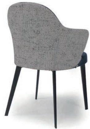
LOLA SESSEL zweifarbige Polsterung Material kundenseits