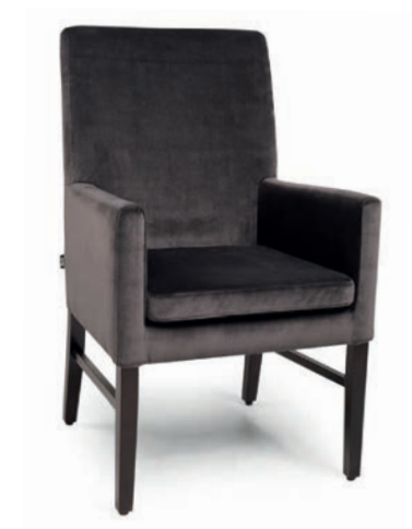
GLASGOW SESSEL nussbaum VELLUTO anthracite 97 62 66 49