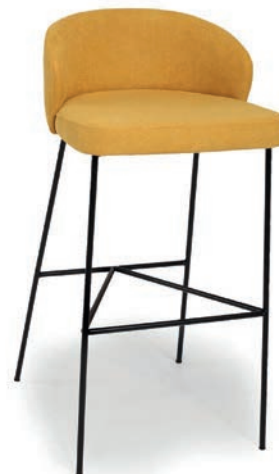
DARFORD 2 M SESSEL