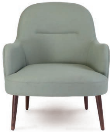
DA VINCI 5 LOUNGESESSL Polsterart A wenge Material kundenseits h A h h 80 66 83 41

Esche gebeizt, verschiedene Polsterarten, Robustagleiter Kunststoff