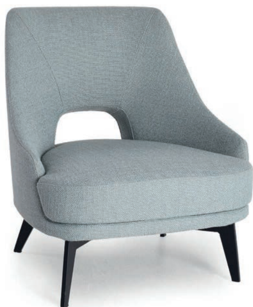
VICTORIA 72 LOUNGESESSL Material kundenseits 80 72 77 40