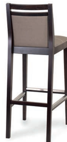
6465 BARHOCKER nussbaum Material kundenseits