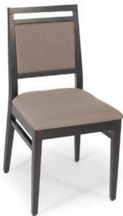
670 STUHL nussbaum Material kundenseits 90 45 53 47