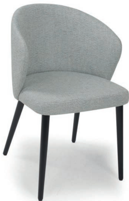
DARFORD 2 SESSEL wenge Material kundenseits