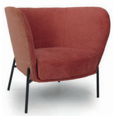
VERENA LOUNGESESSL zweifarbige Polsterung Material kundenseits

Großrapportige oder karierte Stoffe, sowie zweifarbige Polsterungen werden mit 5 % Mehrpreis berechnet, Lederverarbeitung und Rapportbeachtung auf Anfrage.