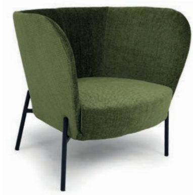
VERENA LOUNGESESSL Material kundenseits