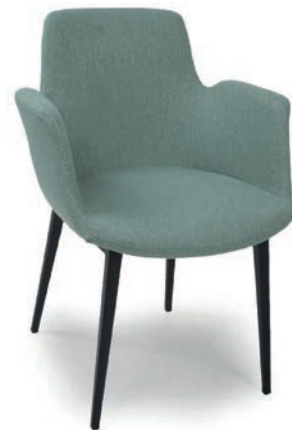
4117 SESSEL Material kundenseits