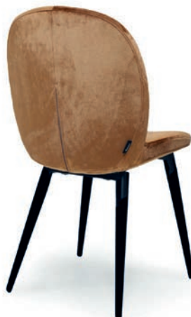
ELMA STUHL VELLETO RE PALAZZO 074