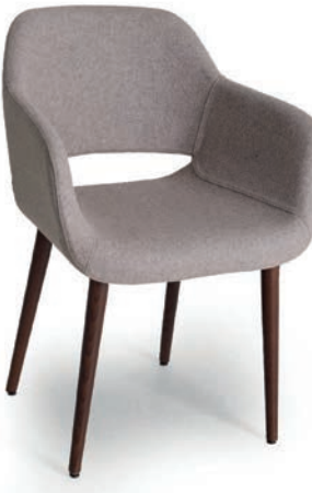
MAGDA SESSEL walnuss FANA RE Dolphin h A h h 83 63 61 47