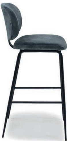
LAVIO BARHOCKER ABEL Petrol