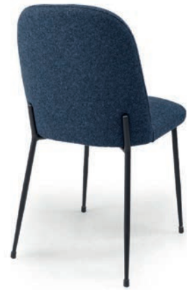
ELIA STUHL FANA RE Blue

Weitere Gestellfarben auf Anfrage. Großrapportige oder karierte Stoffe, sowie zweifarbige Polsterungen werden mit 5% Mehrpreis berechnet, Lederverarbeitung und Rapportbeachtung mit 10%.