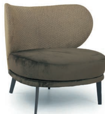
MABEL LOUNGESESSEL zweifarbige Polsterung Material kundenseits