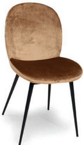
ELMA STUHL VELLETO RE PALAZZO 074