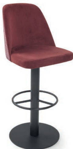
MODENA BAR 8