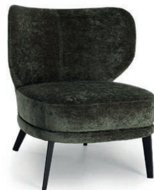
MABEL SMALL LOUNGESESSEL LIVIA Forest

Großbrapportige oder karierte Stoffe, sowie zweifarbige Polsterungen werden mit 5 % Mehrpreis berechnet, Lederverarbeitung und Rapportbeachtung + 10 %.