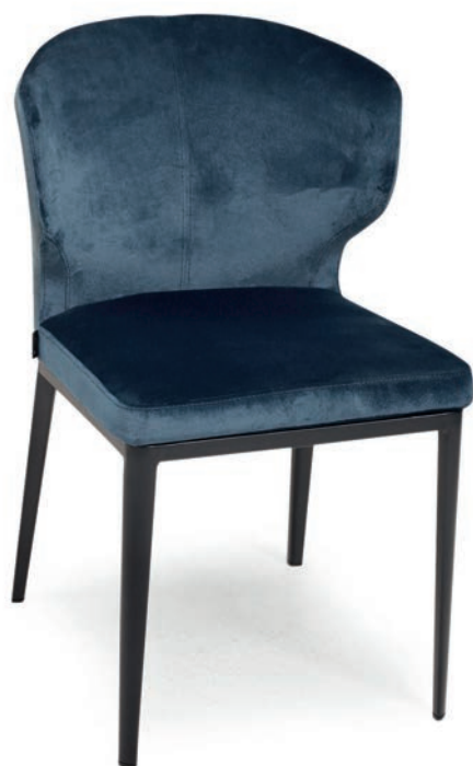
4111 M SESSEL PALAZZO 051