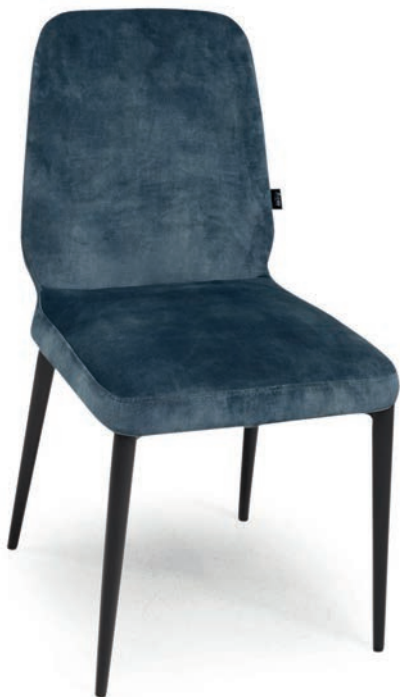
4148 STUHL ABEL Indigo