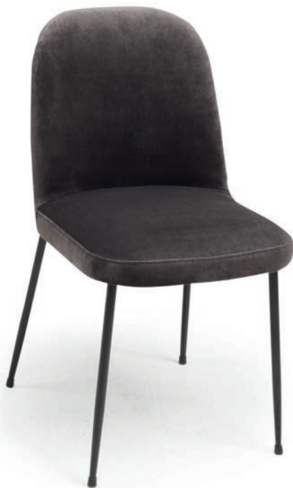
ELIA STUHL VELLETO RE Graphite