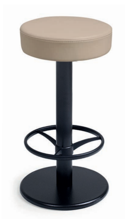
BARTENDER 1 Stegpolsterung 10 cm Sitz drehbar, Ø 37 cm Gewicht 14 kg GKL Hellbeige