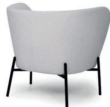
VERENA LOUNGESESSL APIA Ivory