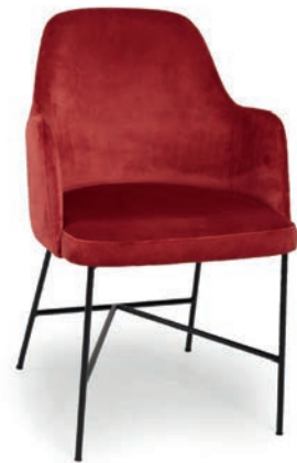
LOVENA 2 M SESSEL Material kundenseits 84 56 59 49