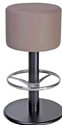
BARTENDER 4 zylindrischer Polsterkopf Sitz drehbar, Ø 37 cm Gewicht 18 kg GKL Taupe A h h 43 43 77