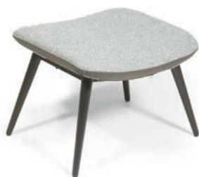
NICA HOCKER zweifarbige Polsterung Material kundenseits 55 47 41