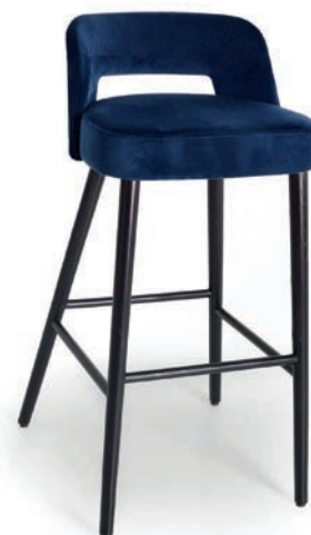
COCKTAIL 2 BARHOCKER VELLUTO Indigo