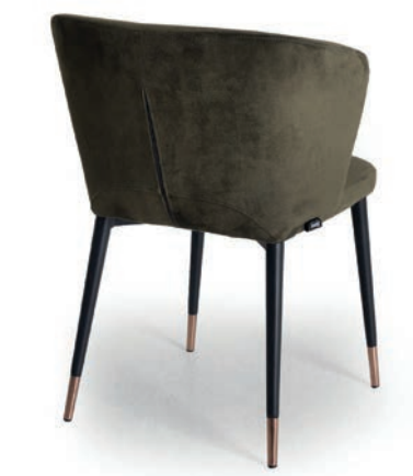
TAFT 2 SESSEL Beinkappen Kupferoptik Material kundenseits