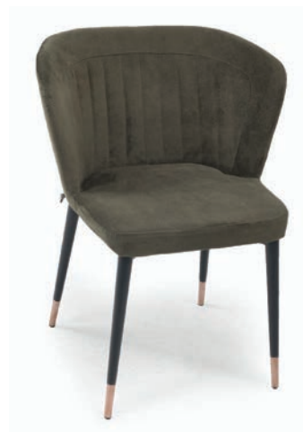
TAFT 2 SESSEL Beinkappen Kupferoptik 76 58 54 47 Material kundenseits senkrechte Steppung im Rücken