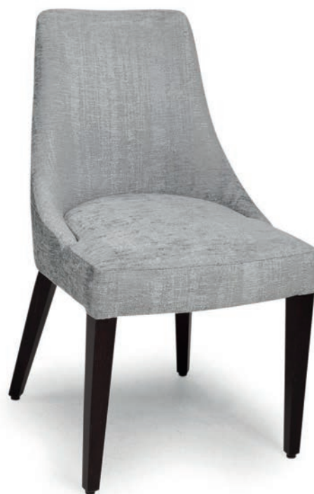
6604 STUHL wenge FLORENCE 19 85 50 60 47

Großrapportige oder karierte Stoffe, sowie zweifarbige Polsterungen werden mit 5 % Mehrpreis berechnet, Rapportbeachtung mit 10 %. Lederverarbeitung auf Anfrage.