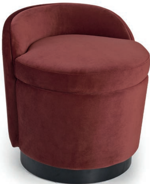
MOMA HOCKER Laminat schwarz VELLETO RE Burgundy