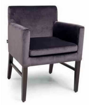
TONY SESSEL nussbaum VELLUTO anthracite 79 62 58 49