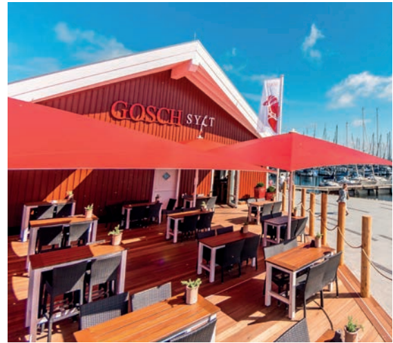
Gosch Sylt, Heiligenhafen