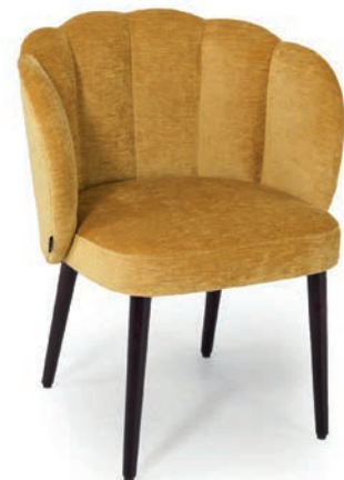
ASTORIA SESSEL schwarz LIVENZA Gold 78 64 60 47