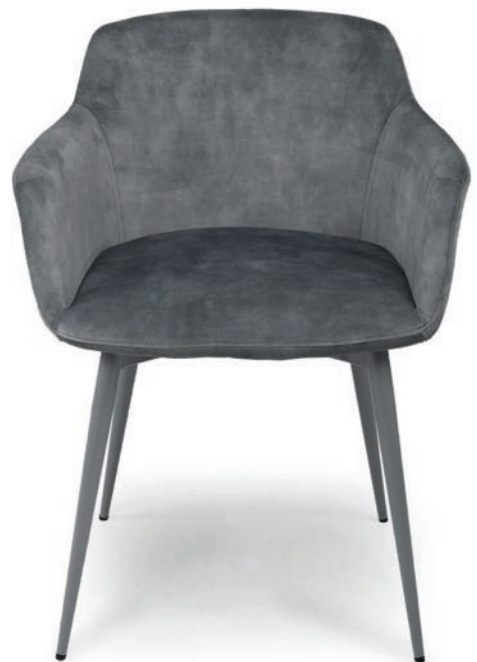
4116 M SESSEL Metallgestell RAL 7031 ABEL Steel h A h h 75 60 58 47