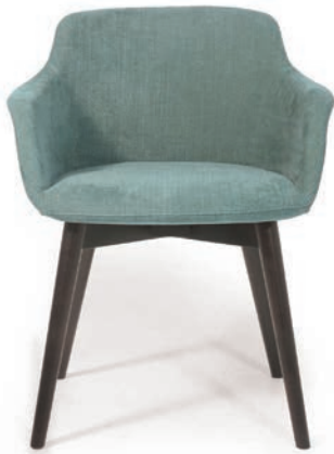
4116 H SESSEL Buche wenge Material kundenseits h A h h 76 60 58 47