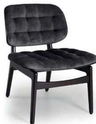
SAINTFIELD H LOUNGESTUHL mit Heftung ABEL Darkgrey