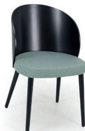
FLYNN SESSEL S + R gepolstert wenge FLORENCE 19