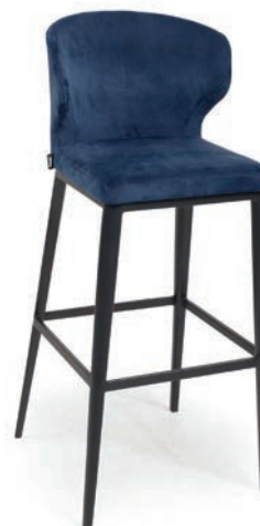
4111 M BARHOCKER VELLUTO Navy 108 48 51 80