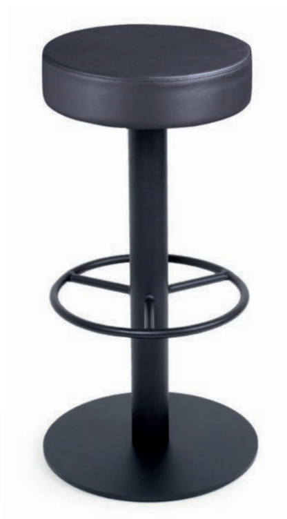
MODENA BAR 1 Stegpolsterung 10 cm Sitz drehbar, Ø 37 cm Gewicht 14 kg CKL schwarz