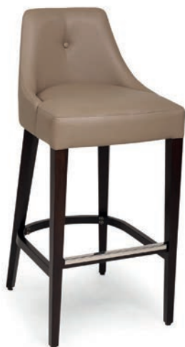
6605 BARHOCKER inkl. Inoxfußschiene GKL Mittekbraun 102 45 54 76