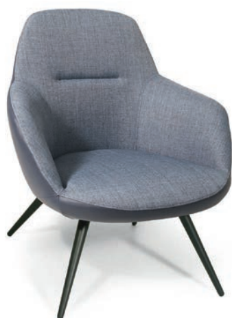
OLINA LOUNGESESSL zweifarbige Polsterung Material kundenseits

Großbrapportige oder karierte Stoffe, sowie zweifarbige Polsterungen werden mit 5 % Mehrpreis berechnet, Lederverarbeitung und Rapportbeachtung auf Anfrage.