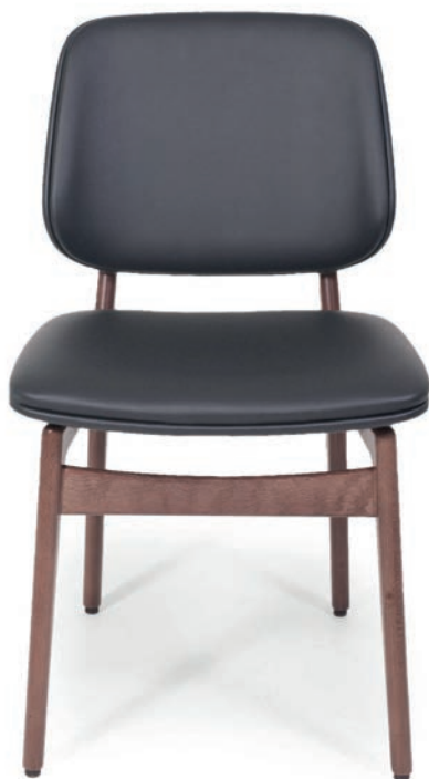
SAINTFIELD 1 STUHL ohne Heftung und Rücken umpolstert VITA Noir