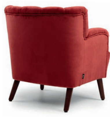
nussbaum RICHMOND Carmine

Großrapportige oder karierte Stoffe, sowie zweifarbige Polsterungen werden mit 5 % Mehrpreis berechnet, Lederverarbeitung und Rapportbeachtung + 10 %. Andere Sitzhöhen auf Anfrage.