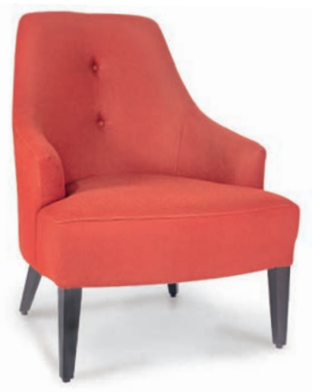
6607 LOUNGESESSEL wenge FANA RE rot 88 69 83 43