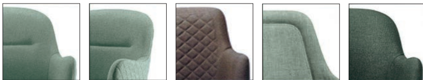
A B C D E