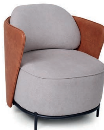
HEKA LOUNGESESEL zweifarbige Polsterung Material kundenseits

Großrapportige oder karierte Stoffe, sowie zweifarbige Polsterungen werden mit 5 % Mehrpreis berechnet, Lederverarbeitung und Rapportbeachtung auf Anfrage.