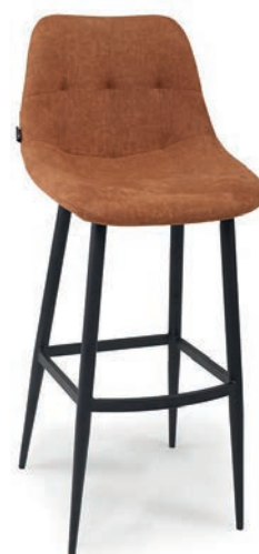
DODGER BARHOCKER Material kundenseits 113 47 54 81