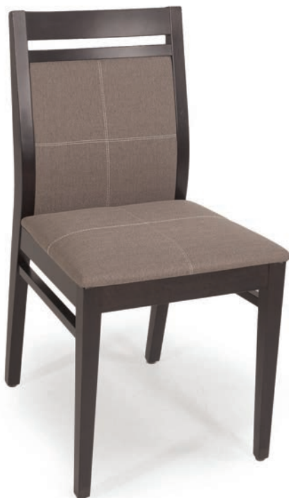
6435-1 STUHL nussbaum Material kundenseits