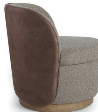
Laminat Eiche APIA Beige Rücken: NAMUR Brown 15