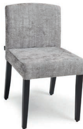
BRIGHTON 1 STUHL wenge FLORENCE 13

Großrapportige oder karierte Stoffe, sowie zweifarbige Polsterungen werden mit 5 % Mehrpreis berechnet, Lederverarbeitung und Rapportbeachtung mit 10 %.