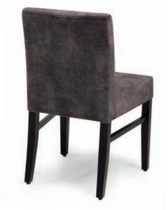
ARTUR 1 STUHL nussbaum ABEL coffee

Buche oder Eiche Standard gebeizt: natur, nussbaum, wenge, schwarz Sitz und Rücken gepolstert, Robustagleiter Kunststoff