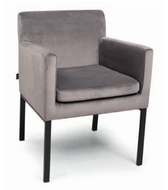
TONY M SESSEL matt schwarz VELLUTO Dolphin

Großrapportige oder karierte Stoffe, sowie zweifarbige Polsterungen werden mit 5 % Mehrpreis berechnet, Lederverarbeitung und Rapportbeachtung mit 10 %.