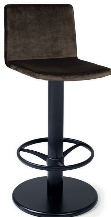
BARTENDER 6 Sitz drehbar, Gewicht 19,2 kg VELLUTO Hunter