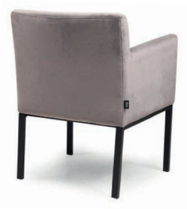
TONY M SESSEL matt schwarz VELLUTO Dolphin