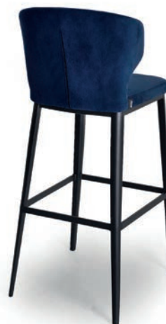
4111 M BARHOCKER VELLUTO Navy