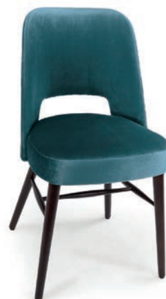
COCKTAIL 2 STUHL PALAZZO 081