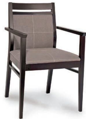
6435-2 SESSEL nussbaum Material kundenseits 86 55 57 47

Großrapportige oder karierte Stoffe, sowie zweifarbige Polsterungen werden mit 5 % Mehrpreis berechnet, Lederverarbeitung und Rapportbeachtung auf Anfrage.