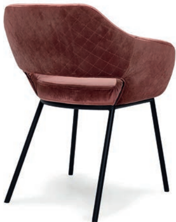
MANU M SESSEL matt schwarz PALAZZO 065 Rücken PERINO 065