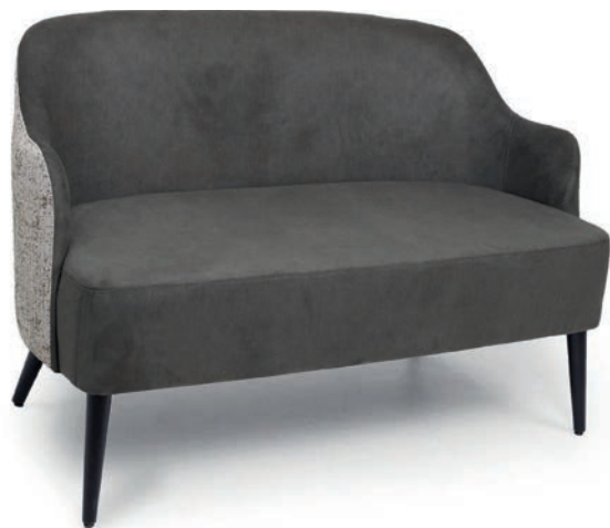
LOVENA LOUNGESOFA wenge Material kundenseits