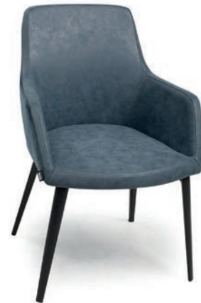
4109 SESSEL NUBOLA 18