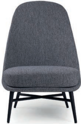
LAUREN LOUNGESESSSEL Material kundenseits