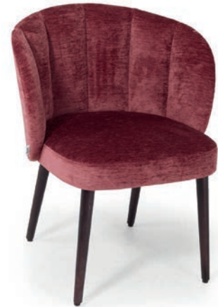
ASTOR SESSEL nussbaum LIVENZA Burgundy 78 64 60 47

Großrapportige oder karierte Stoffe, sowie zweifarbige Polsterungen werden mit 5 % Mehrpreis berechnet, Lederverarbeitung und Rapportbeachtung auf Anfrage.