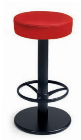
BARTENDER 1 GKL Rot