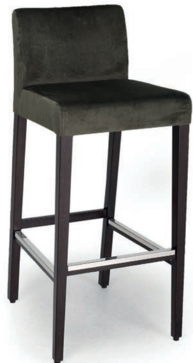
621-3 BARHOCKER Fußschiene Inox VELLUTO Hunter