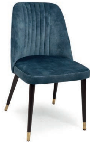
LOVENA 1 STUHL Pfeifensteppung Stuhlbeinkappen wenge ABEL Indigo