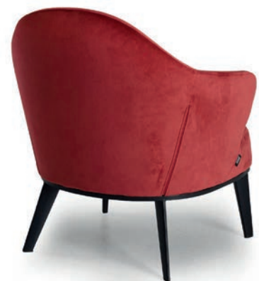
LOLA LOUNGESESSEL Material kundenseits