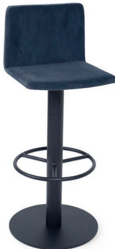
MODENA BAR 6