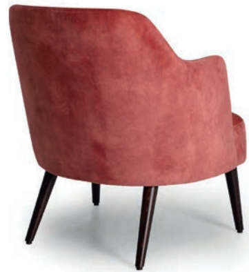
wenge ABEL Blush

Großrapportige oder karierte Stoffe, sowie zweifarbige Polsterungen werden mit 5 % Mehrpreis berechnet, Lederverarbeitung und Rapportbeachtung auf Anfrage.