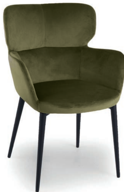
BRODY SESSEL VELLUTO Turtle