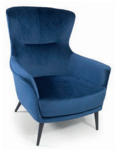
VIVIANE LOUNGESESSL VELLETO RE Indigo

Großbrapportige oder karierte Stoffe, sowie zweifarbige Polsterungen werden mit 5 % Mehrpreis berechnet, Lederverarbeitung und Rapportbeachtung auf Anfrage.