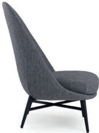
LAUREN LOUNGESESSSEL Material kundenseits