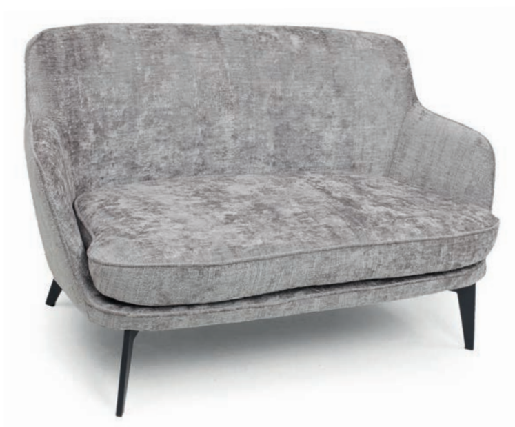
TAYLOR ZWEISITZER FLORENCE 13