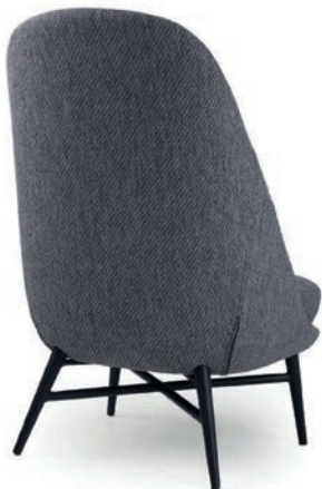
LAUREN LOUNGESESSSEL Material kundenseits