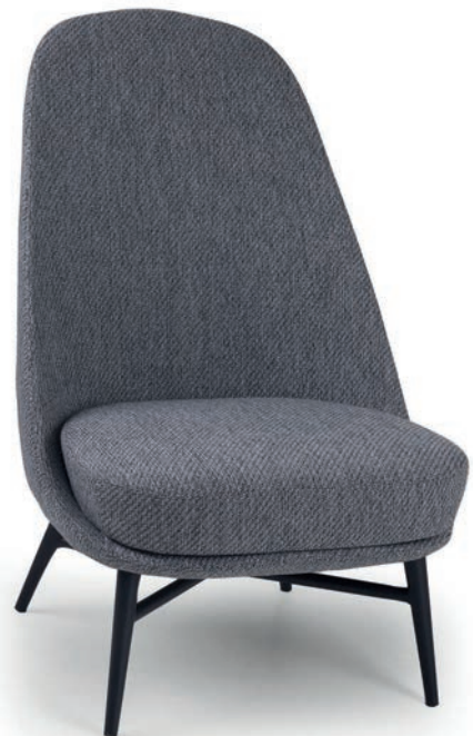
LAUREN LOUNGESESSSEL Material kundenseits

Großbräpportige oder karierte Stoffe, sowie zweifarbige Polsterungen werden mit 5 % Mehrpreis berechnet, Lederverarbeitung und Rapportbeachtung auf Anfrage.