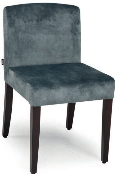
BRIGHTON 1 STUHL wenge ABEL Niagara