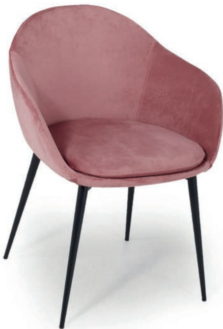
VIVAL SESSEL Material kundenseits