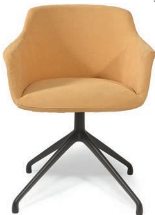
4116 SPIN / M SESSEL Material kundenseits h A h h 78 60 57 45