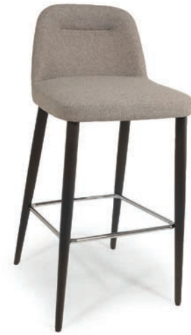
DA VINCI 1 BARHOCKER Polsterart A wenge Material kundenseits h A h h 100 47 52 75