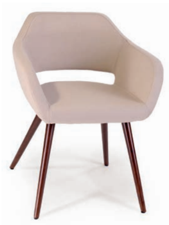
MANU H SESSEL walnuss Material kundenseits 76 62 58 46