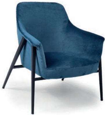
CLEVELAND 2 LOUNGESESSEL VELLUTO Navy

Großbrportige oder karierte Stoffe, sowie zweifarbige Polsterungen werden mit 5 % Mehrpreis berechnet, Lederverarbeitung und Rapportbeachtung auf Anfrage.