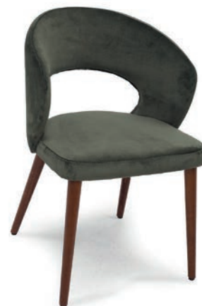
DARFORD 2/O SESSEL

Großrapportige oder karierte Stoffe, sowie zweifarbige Polsterungen werden mit 5 % Mehrpreis berechnet, Lederverarbeitung und Rapportbeachtung auf Anfrage.