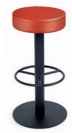
MODENA BAR 1 CKL Rot