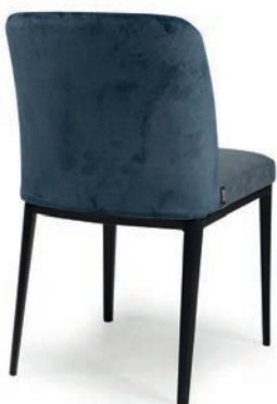
4101 STUHL NUBOLA 18 Rücken VELLETO RE Indigo