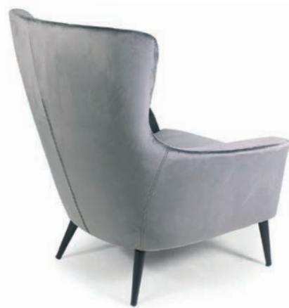
VIVIANE LOUNGESESSL VELLUTO Dolphin