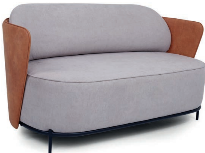
HEKA ZWEISITZER zweifarbige Polsterung Material kundenseits