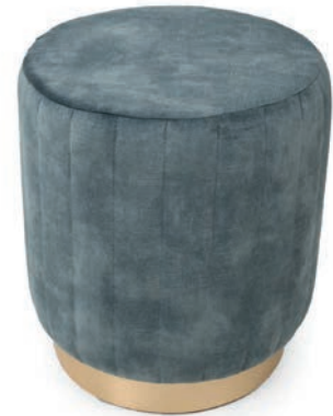
BOTTE R 39/60 HOCKER Sockelhöhe 60 mm Messing Polsterung mit Pfeifen ABEL Niagara

GroÙrapportige oder karierte Stoffe, sowie zweifarbige Polsterungen werden mit 5 % Mehrpreis berechnet, Lederverarbeitung und Rapportbeachtung mit 10 %.