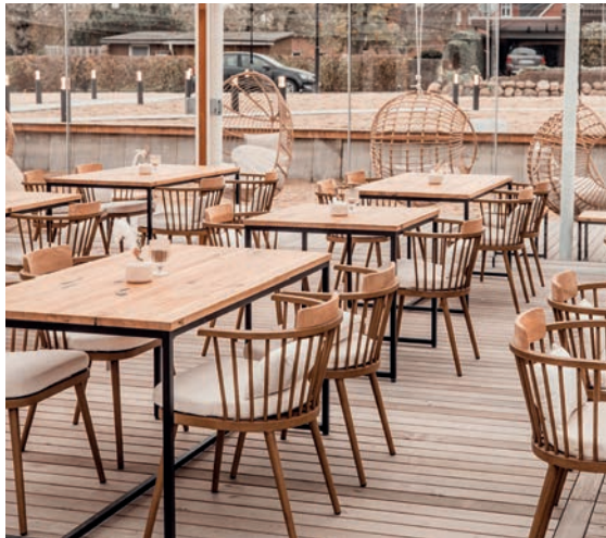
gut salzig Restaurants, Stein

Prämierte Bars, coole Cafés, Luxusrestaurants, Bäckereiketten, Sushi-Tempel, Meeting-Bereiche im Großraumbüro, Burger-Läden - von praktisch robust bis edel luxuriös - unsere Referenzen sind so vielseitig wie unser Programm! Überzeugen Sie sich selbst: