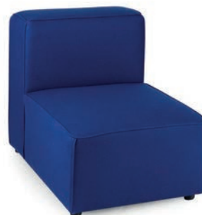
VARSO STUHLELEMENT Material kundenseits 75 65 90 43