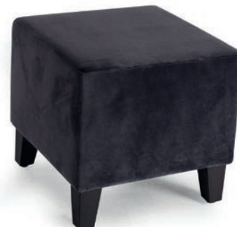
KUBIK 40 HOCKER nur mit Keder erhältlich wenge FANA RE Dolphin