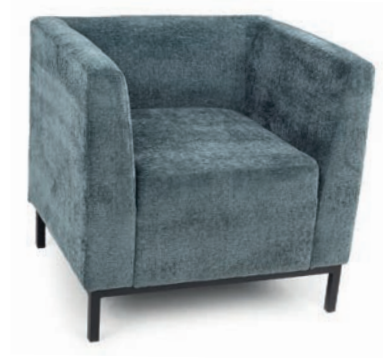
SOLO SESSEL schwarz Material kundenseits 72 75 65 46

Großrapportige oder karierte Stoffe, sowie zweifarbige Polsterungen werden mit 5 % Mehrpreis berechnet, Lederverarbeitung und Rapportbeachtung mit 10 %.