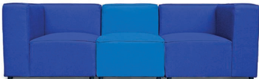
VARSO ENDELEMENT links oder rechts 75 90 90 43 Material kundenseits