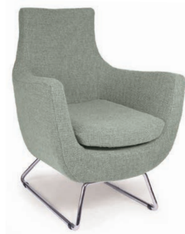
Kufengestell verchromt Material kundenseits 89 73 72 44