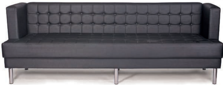
MADRID BANK mit Seitenteilen und Knopfheftung rundes Metallgestell verchromt Material kundenseits