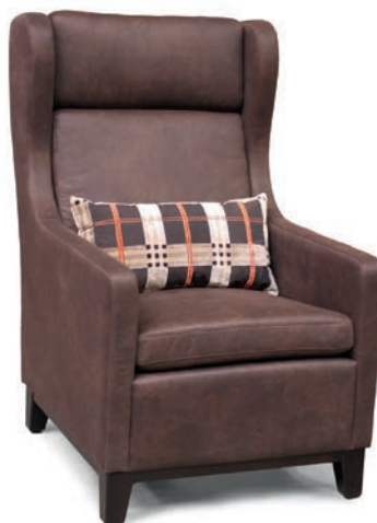
DOUGLAS OHRENSESSEL wenge Material kundenseits 107 67 85 47

Großrapportige oder karierte Stoffe, sowie zweifarbige Polsterungen werden mit 5 % Mehrpreis berechnet, Lederverarbeitung und Rapportbeachtung mit 10 %.