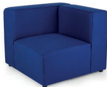
VARSO ENDELEMENT links oder rechts 75 90 90 43 Material kundenseits