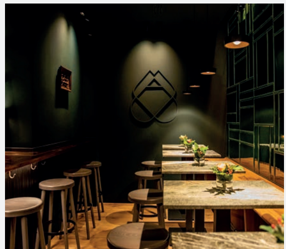
Max Emanuel Brauerei München