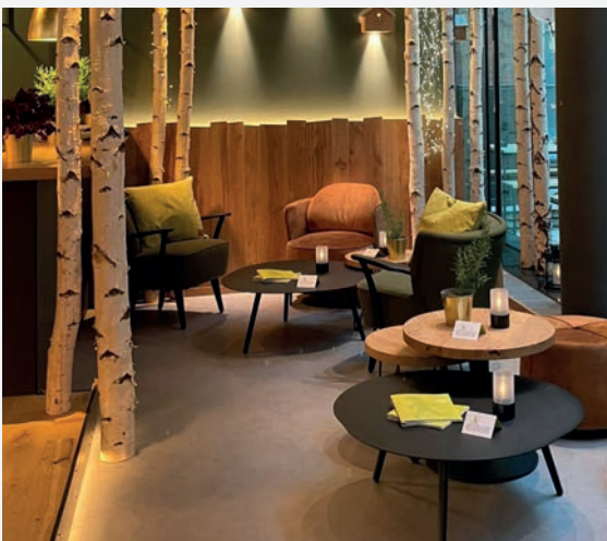
Hans im Glück, Konstanz