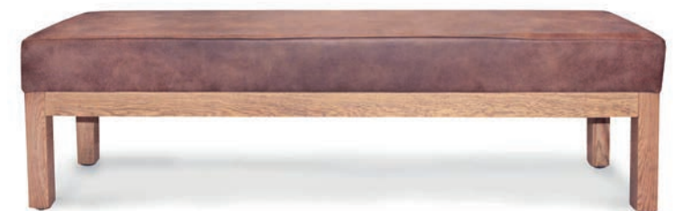
MANSFIELD BANK maximale Breite 1,50 m