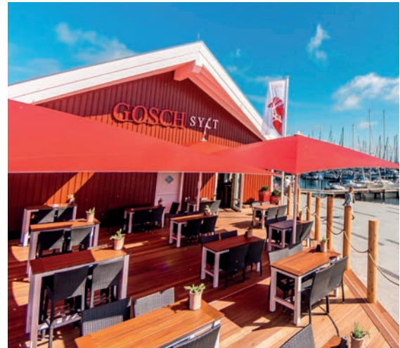
Gosch Sylt, Heiligenhafen