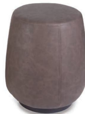
ANKARA HOCKER Sockel schwarz WESTERN Almond

Großbräpportige oder karierte Stoffe, sowie zweifarbige Polsterungen werden mit 5 % Mehrpreis berechnet, Lederverarbeitung und Rapportbeachtung mit 10 %.