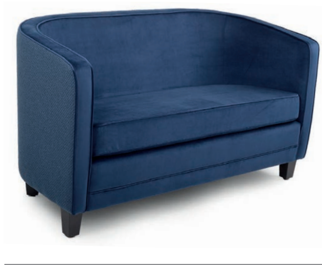
BRISTOL ZWEISITZER wenge zweifarbige Polsterung Material kundenseits

GroÙrapportige oder karierte Stoffe, sowie zweifarbige Polsterungen werden mit 5 % Mehrpreis berechnet, Lederverarbeitung und Rapportbeachtung mit 10 %.