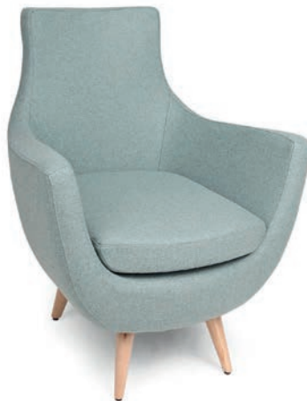
PAM SESSEL Eiche natur Material kundenseits 89 73 72 44

Großrapportige oder karierte Stoffe, sowie zweifarbige Polsterungen werden mit 5 % Mehrpreis berechnet, Lederverarbeitung und Rapportbeachtung mit 10 %.