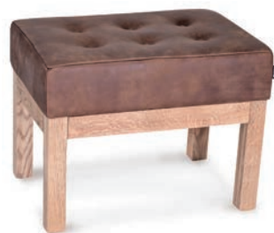
MANSFIELD HOCKER Knopfheftung Eiche natur