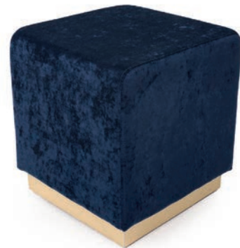
BOTTE E 42/60 HOCKER Sockelhöhe 60 mm Messing Material kundenseits