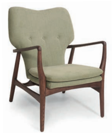
RANDERS LOUNGESESSEL abnehmbares Sitzkissen classic walnut Material kundenseits h A h h 86 68 82 45

Großbrappartige oder karierte Stoffe, sowie zweifarbige Polsterungen werden mit 5 % Mehrpreis berechnet.