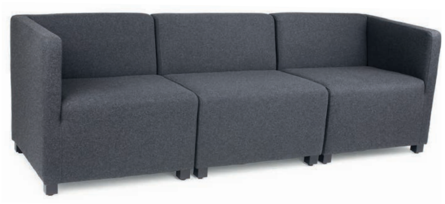
BRADFORD ENDELEMENT links oder rechts Material kundenseits h A h h 70 70 70 43