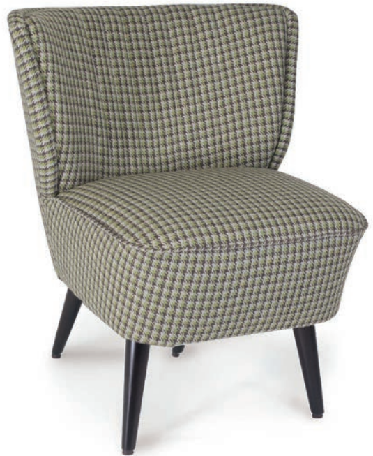
NONNA 1 STUHL Buche schwarz Material kundenseits 74 67 68 47