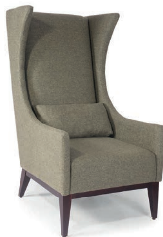
DANTE OHRENSESSEL nussbaum Material kundenseits h A h h 119 70 89 43

Großbräpportige oder karierte Stoffe, sowie zweifarbige Polsterungen werden mit 5 % Mehrpreis berechnet, Lederverarbeitung und Rapportbeachtung mit 10 %.