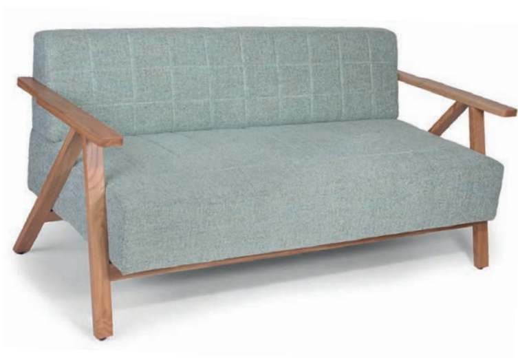
MARSELLUS ZWEISITZER Eiche natur TILA Lightblue