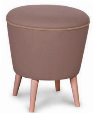
PIET HOCKER natur Material kundenseits

Großrapportige oder karierte Stoffe, sowie zweifarbige Polsterungen werden mit 5 % Mehrpreis berechnet, Lederverarbeitung und Rapportbeachtung mit 10 %.