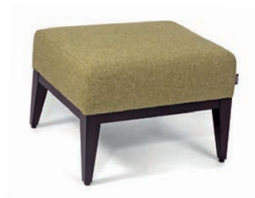
DANTE HOCKER wenge Material kundenseits A h h 57 47 40