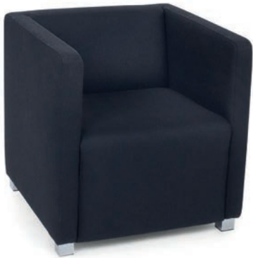
BRADFORD SESSEL Metallfüße verchromt Material kundenseits h A h h 68 66 68 44