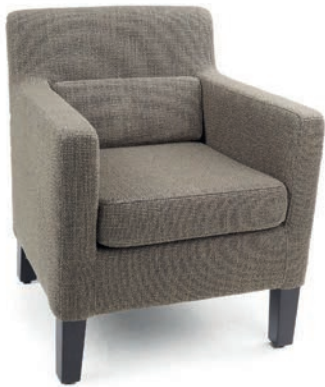
LORD SESSEL wenge Material kundenseits 78 65 69 46

Füße Buche gebeizt: natur, nussbaum, wenge, schwarz Sitz und Rücken gepolstert, inklusive losen Rückenkissen, Robustagleiter Kunststoff