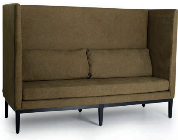
* Ausführung mit geraden Armlehnen

Großrapportige oder karierte Stoffe, sowie zweifarbige Polsterungen werden mit 5 % Mehrpreis berechnet, Lederverarbeitung und Rapportbeachtung mit 10 %. Kein Einzelversand möglich.