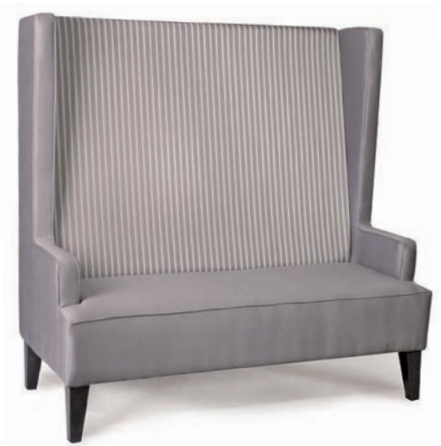
COSY E POLSTERBANK mit Seitenteilen Füße Buche schwarz gebeizt zweifarbige Polsterung Material kundenseits