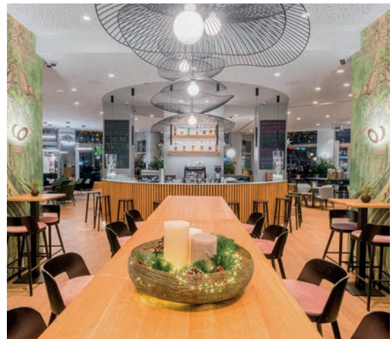
KOOS Hotel&Apartments, München