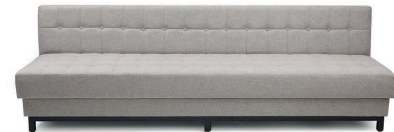
MADRID LOUNGE BANK mit Knopfheftung Gestell Buche, schwarz gebeizt Material kundenseits