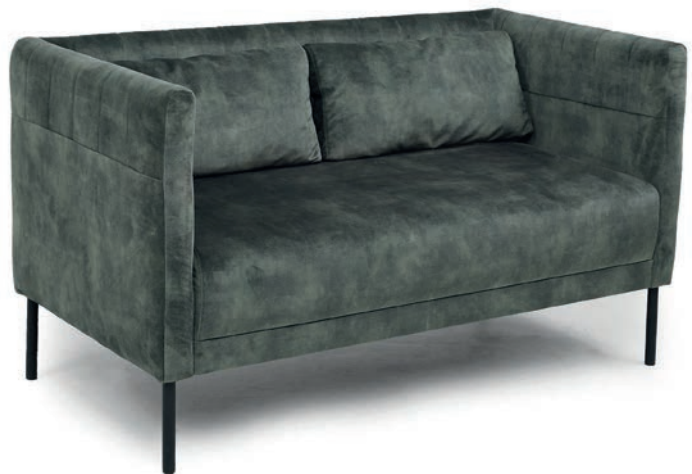
BETTI ZWEISITZER ABEL Hunter

Großrapportige oder karierte Stoffe, sowie zweifarbige Polsterungen werden mit 5 % Mehrpreis berechnet, Lederverarbeitung und Rapportbeachtung mit 10 %.