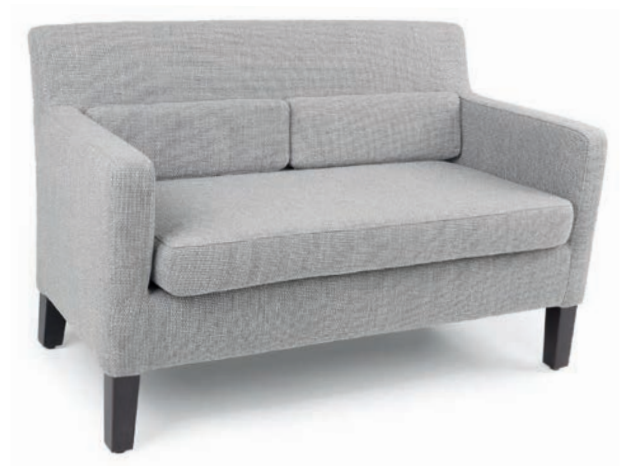
LORD ZWEISITZER schwarz Material kundenseits

Großrapportige oder karierte Stoffe, sowie zweifarbige Polsterungen werden mit 5 % Mehrpreis berechnet, Lederverarbeitung und Rapportbeachtung mit 10 %.