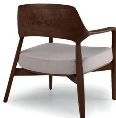
AVILA LOUNGESESEL nussbaum Material kundenseits