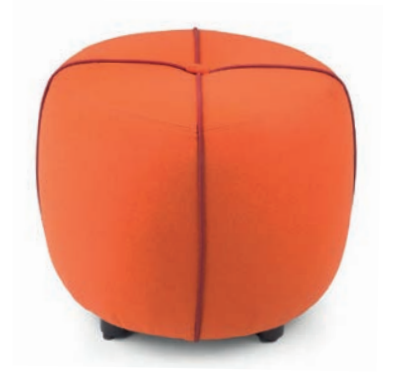
PONGO HOCKER wenge Material kundenseits