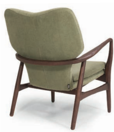
RANDERS LOUNGESESSEL classic walnut Material kundenseits