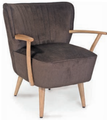
NONNA 2 SESSEL Eiche natur Material kundenseits 74 68 68 47 Rücken mit Steppung