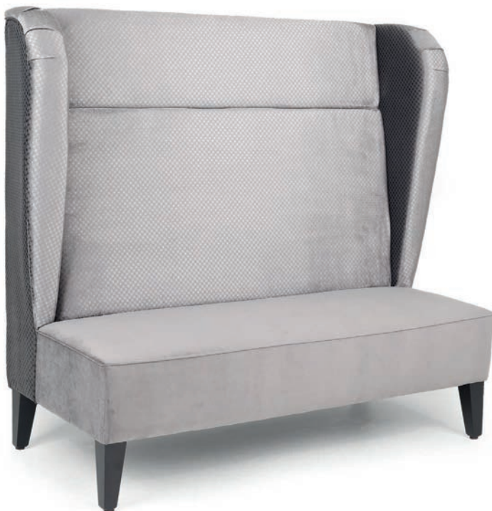
COSY R POLSTERBANK mit Seitenteilen Füße Buche schwarz gebeizt

Großrapportige oder karierte Stoffe, sowie zweifarbige Polsterungen werden mit 5 % Mehrpreis berechnet, Lederverarbeitung und Rapportbeachtung mit 10 %.