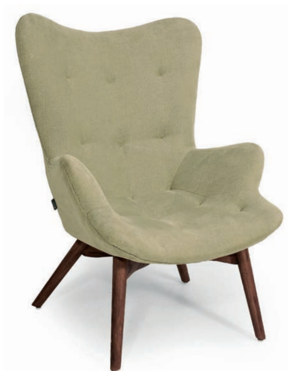
FEATHERTON LOUNGESESSEL classic walnut Material kundenseits h A h h 96 68 80 38