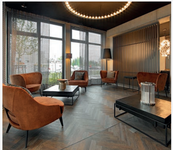
Hotel Zeitgeist, Warburg