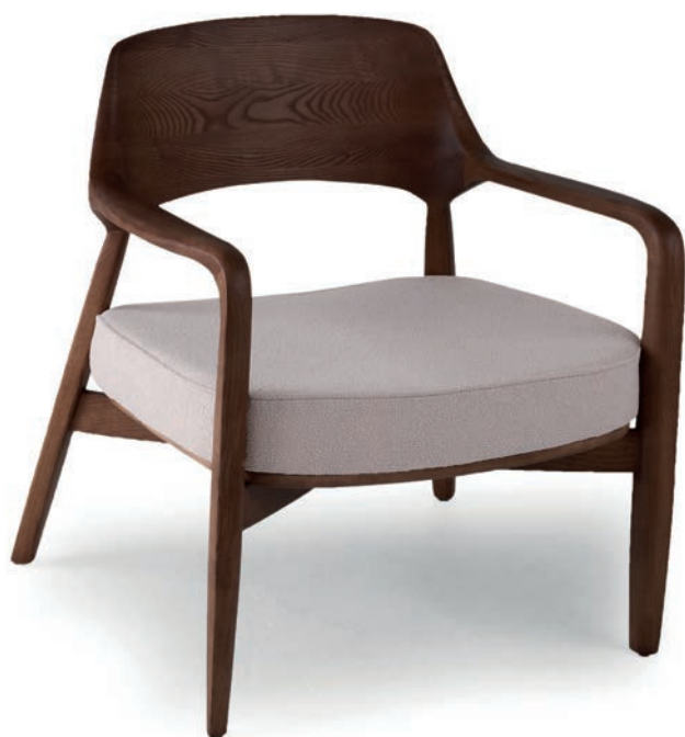
AVILA LOUNGESESEL nussbaum Material kundenseits

Großrapportige oder karierte Stoffe, sowie zweifarbige Polsterungen werden mit 5 % Mehrpreis berechnet, Lederverarbeitung und Rapportbeachtung auf Anfrage.