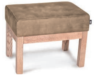
MANSFIELD HOCKER ohne Knopfheftung Eiche natur