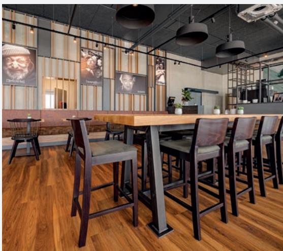
Zündwerk Motel, Strasshof