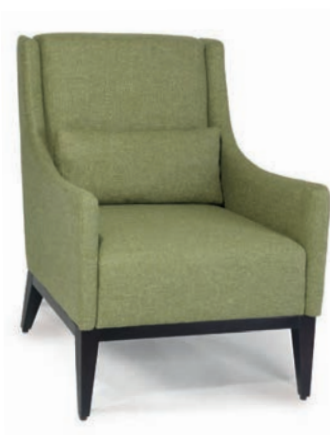
DANTE SESSEL wenge Material kundenseits h A h h 88 70 85 45