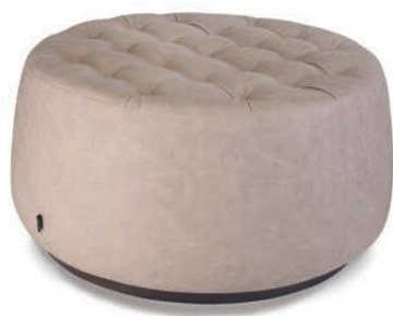
IZMIR HOCKER Sitz mit Knopfheftung Sockel schwarz Material kundenseits